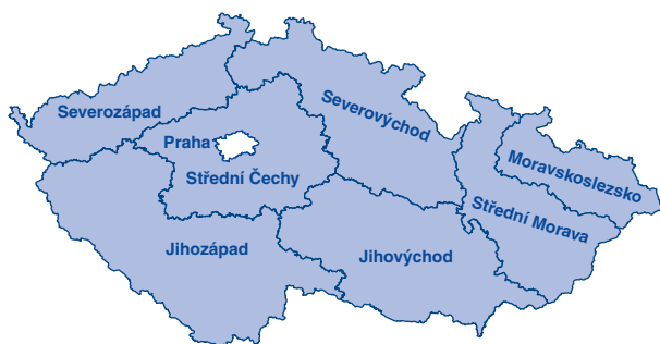
Oblasti podpory RPS