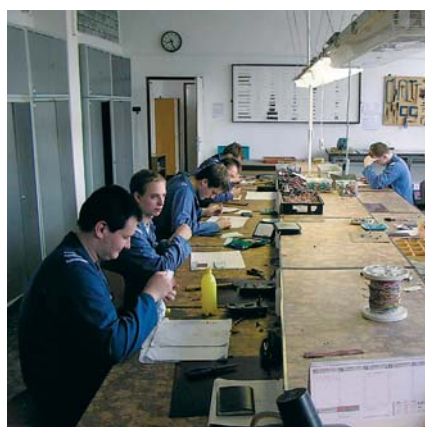
Praktická výuka na Středním odborném učiliště elektrotechnickém v Plzni.