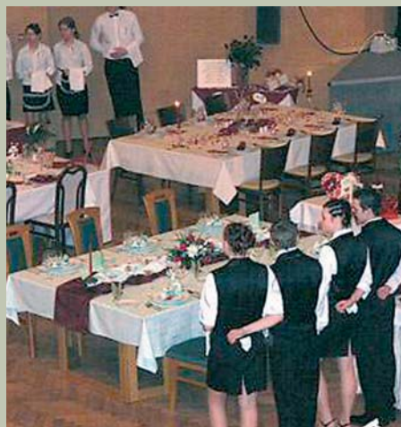
Loňský jubilejní 10. ročník Regionální soutěže žáků středních škol.