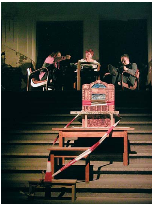
Duše není kámen - závěrečná scéna nad maketou nádraží a pod Damoklovým mečem dražby.

2006 Duše není kámen (představení vzešlé z dílny s Olegem Zukošským v rámci sekce Hemžici se zastávka Mezinárodní festivalu Divadlo 2006)