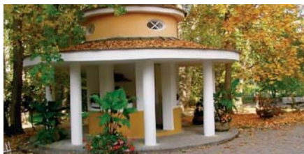
Konstantinovy Lázně jsou jediným lázeňským městem na území Plzeňského kraje.

pro oblast cestovního ruchu, marketingu a neziskových organizací Olga Kalčíková. Region Šumava se v průzkumu jeví jako nejlepší z pohledu služeb pro motoristy, dopravní infrastruktury, v hodnocení místního orientačního značení a péče o životní prostředí. Region Plzeňsko naopak v úrovni služeb nepatří k nejlepším. Oproti létu