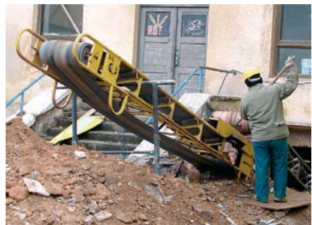
V objektu už začala stavební firma s vyklizením všech prostor, aby mohla začít rekonstrukce co nejdříve.

Záměrem Studijní a vědecké knihovny je umístit do zrekonstruovaných prostor především provozy, které nejsou přímo spojené s prací se čtenáři, například nákup a zpracování fondů, zámečnickou a truhlářskou dílnu údržby, záchranou stanic, kde by bylo možné čistit kontaminované knihy a dokumenty, depozitáře s posuvnými regály a restaurátorskou dílnu. Pro veřejnost je