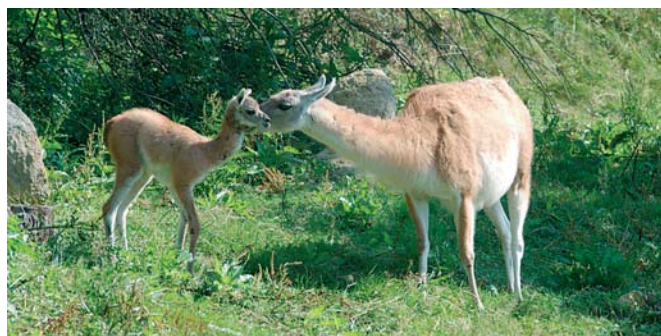
Únorovým cílem soutěže se stane plzeňská zoo.

Další úkol, tentokrát na měsíc únor, najdete na této stránce pod známým logem soutěže Plzeňské kvítka. Přírodovědnou soutěž pro děti ve věku 12–15 let pořádá Krajský úřad Plzeňského kraje a Základní organizace Svazu ochránců přírody ve Spálené Poříčí.