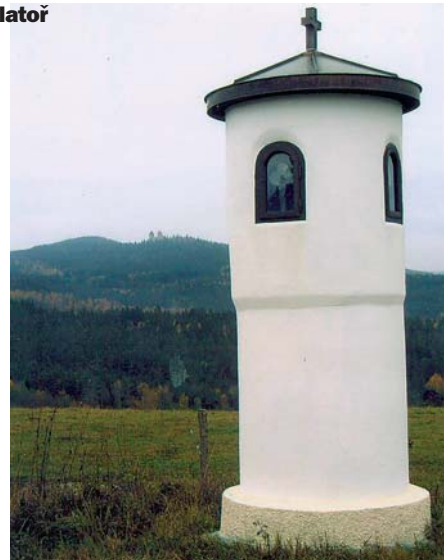
Válcovitá boží muka mezi Platoři a Bohdašicemi, tvarově i velikostí v kraji zcela unikátní.

Před 30 lety na Platoři nežil ani jediný trvale bydlící obyvatel, původní obyvatelé byli odsunuti v roce 1946. Končiny byly nehostinné i pro náhodné turisty. Žádné prozrazení, upravené cesty, informace, zmínky v bedrech, ba ani možnost posezení a občerstvení, nepočítáme-li řadu pramenů s báječnou křísťalovou čistou vodou. Jen tu a tam zmínka o krajové zvláštnosti: několik samot má podivné jméno Tri prdelky. Zavítejte do těchto malebných končin dnes a uvidíte sami, co se za poslední roky změnilo k lepšímu, nebo se pokochejte místní celebritou – majestátní lípou a zároveň druhým nejkrásnějším Stromem roku 2006 v České republice.