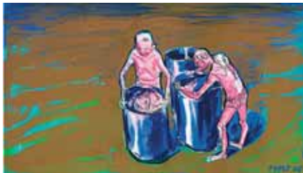
Lubomír Typlt, Diváci se, 2006, tempera na papíře, 50 x 70 cm

Výstavu čtyř výrazných současných českých umělců nazvanou Lovci lebek můžete zhlédnout v Galerii U Bílého jednorozce v Klatovech. Autory jsou Lubomír Typlt, Vladimír Skrepl, Josef Bolf a Luděk Rathouský.