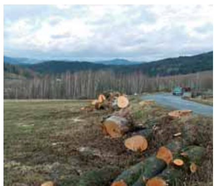
Toto pokácené stromořadí ohrožovalo svými kořeny bezpečnost projíždějících motoristů.

Případný zásah do zeleně konzultujeme se samosprávou příslušné obce. V obcích a mezi spolkovými organizacemi hledáme spolupráci jak pro sázení