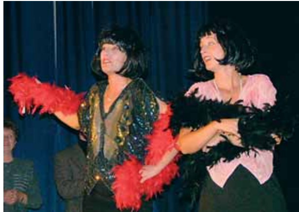
Loni vystupoval divadelní soubor Mlask Manětín s představením Příběh Coco Chanel.

Program na představení nazvané 1+1=3 14. 4. Krašovice 15. 4. Kozolupy 29. 4. Jesenice 18. 5. Kozlany