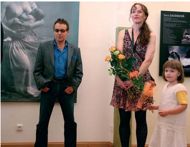
Jan Saudek vystavuje obrazy, zatímco Sára Saudková fotografuje.

S polená výstava obrazů světově známého fotografa Jana Saudka a fotografií jeho přítelkyně Sáry Saudkové je až do 29. 7. 2007 k vidění v reprezentačních prostorách Západočeského muzea v Plzni. Zatímco Sára Saudková přijela do Plzně na vernisáž včas, mistr Saudek dorazil s více než hodinovým zpožděním. „Uvážil jsem v Praze v hrozně