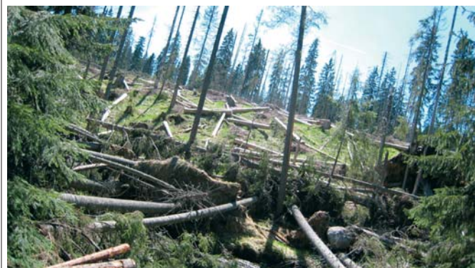
Orkán způsobil na Šumavě obrovské škody.

V úvodu senátního slyšení velmi hezky promluvil místopředseda senátu Petr Pithart. Nabádal ke spolupráci a k objektivnímu jednání o rizicích v Národním parku Šumava. Jako představitel samospráv Plzeňského kraje se také přimlouvám za tento způsob řešení problému. Vždyť obyvatele žijící v CHKO Šumava vyznat nelze. Oni zde žijí a oni bezprostředně ponosou důsledky všech negativních změn a rozhodnutí. Zákonový rámec Správy národního parku by měl nakonec harmonicky vytyčit práva a povinnosti obyvatele i ochranu neopakovatelné šumavské přírody.