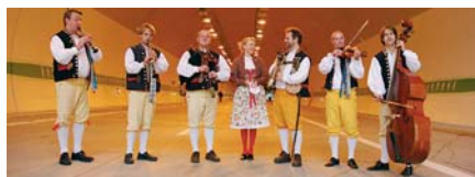
Dudácké kapely nechybí na žádných důležitých akcích v Plzeňském kraji