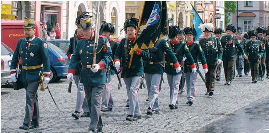
Ostrostřelci ze Stříbra představili svůj nový prapor.