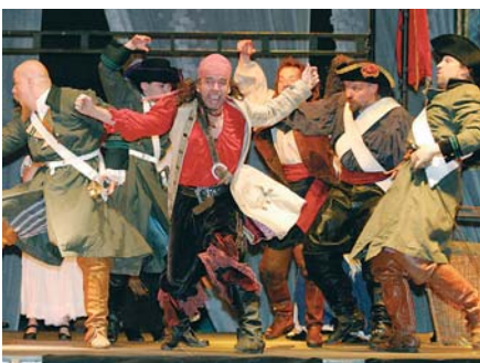
Dokončení ze strany 1