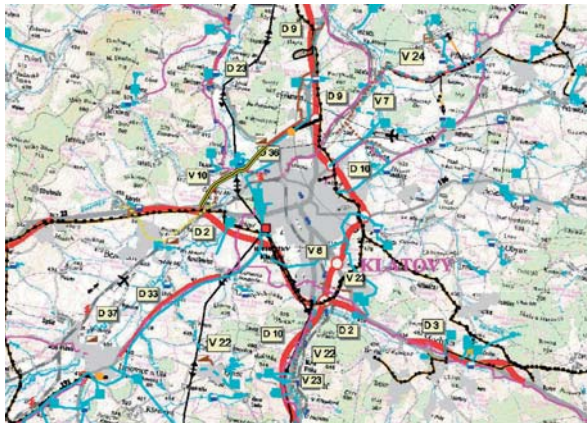
Žlutou barvou je na mapě vyznačeno dokončení západního obchvatu Klatov.