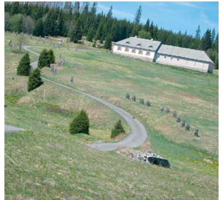
K hájovně na Březníku vede klikatá silnička.

M ilovníky výletů tentokrát nasměrujeme na Šumavu, konkrétně potom na Březník a jeho nejbližší okolí. Nádherná příroda zde jde ruku v ruce s uschlým lesem zničeným před léty kůrovcovou kalamitostí. Určitě je zajímavé vidět vedle sebe živý a mrtvý les. Naše putování začneme v obci Modrava. Na sedm kilometrů vzdálený Březník vede většinou v mírnějším stoupání pěkná asfaltka. Komunikace je proto vhodná nejen pro pěší, ale i pro méně zdatné cyklisty. Březník se nachází ve výšce 1133 m n.m. a jde o samotu s bývalou hájovnou nedaleko od státní hranice se SRN. Od roku 1951 bylo toto místo veřejnosti nepřístupné. Turisté se na Březník vrátili až po roce 1991. V budově bývalé hájovny je dnes Informační středisko správy Národního parku Šumava s galerií fezbářství. Součástí expozice je i část věnovaná Karlu Klostermannovi. Od hájovny, ve které pečou vynikající bramboráky, je krásný pohled na horu Luzný 1373 m n.m. s hohým kamenitým vrcholkem, který obklopuje mrtvý suchý les. Cesta na Luzný a stejně tak i stezka Luzněmským údolím je však turistům stále zapovězena a uzavřena dřevěným zátarasem. Do oblasti nesmí turisté vzhledem k výskytu pu-