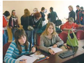
Skoláci si vyzkoušeli jak se sedí v jednacím sále zastupitelů.

Již potřetí se 30. května uskutečnil Den otevřených dveří v budově Krajského úřadu Plzeňského kraje ve Šroupově ulici. Do budovy od rána proudili žáci škol i široká veřejnost. Návštěvníci nejprve shlédli prezentaci o kraji. Zajímavým zastavením byla rovněž návštěva jednacích sálů zastupitelstva v 1. patře či jednacího sálu ve 2. patře, kde pravidelně zasedá Rada Plzeňského kraje. Největší zájem byl samozřejmě o nahlédnutí do pracovního hejtmána Plzeňského kraje Petra Zimmermanna. Pozornosti návštěvníků neunesly ani některé kanceláře úředníků. Příchodní získali i řadu informací o samotném kraji, o krajském zřízení, o složení a činnosti krajské samosprávy. Seznámili se s organizační strukturou úřadu a s náplní jednotlivých odborů. Na závěr mohli návštěvníci vyplnit znalostní kvíz o Plzeňském kraji a zasoutěžit si o fotografickou publikaci o Plzeňském kraji.