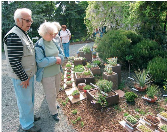
Pěstitele alpinek proměnili zahradu Gymnázia na Mikulášském náměstí v překrásný kout přírody.