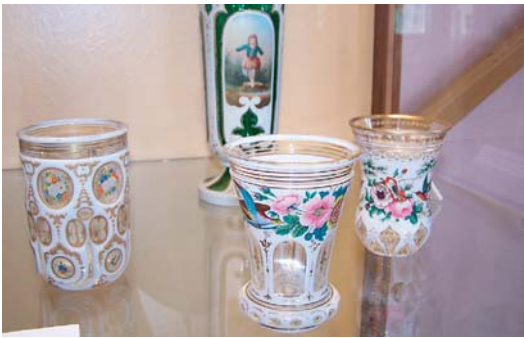
Sbírka skla okouzlí každého návštěvníka muzea.