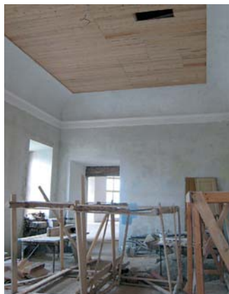
Rada sálů už prošla rozsáhlou rekonstrukcí.