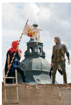
Chotětovský klášter zažije i nelitostné bitvy.