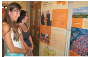
Česká verze výstavy je k vidění v budově Krajského úřadu Plzeňského kraje.

Putovní výstava „Bez hranic – setkávání, dialog, spolupráce“, je nyní k vidění v budově Krajského úřadu Plzeňského kraje. Expozice je ohlédnutím za společnou prací a činností Plzeňského kraje s partnerskými regiony Horní Falc a Dolní Bavorsko. Spolupráce mezi těmito třemi kraji byla zahájena krátce po vzniku nových krajů, tedy v roce 2001. Za těchto šest let se v rámci regionální kooperace mezi Plzeňským krajem a regiony Horní Falc / Dolní Bavorsko vyvíjela rozsáhlá síť přes-