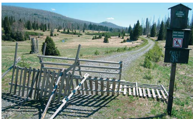
Stezka vedoucí k přechodu Modrý sloup je pod Březníkem přehrazena a pro turisty uzavřena.