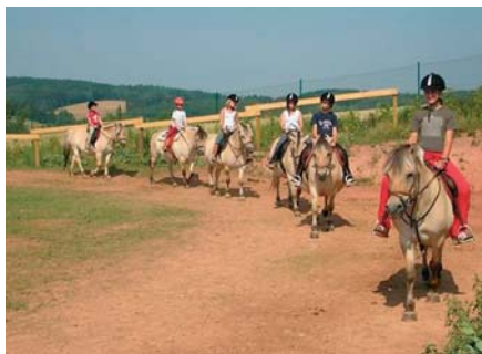
Na některých táborech se děti mohou prohnát i na koních.

V tomto roce rada a zastupitelstvo Plzeňského kraje schválily celkovou podporu ve výši 1 110 000 Kč pro 23 projektů. „Namátkou z nich vybírám podporu pro Střední školu zemědělskou a potravinářskou v Klatovech na dobovování naučné stezky této školy nebo podporu Dne Země v Americké zahradě u Chudenic pro občanské sdružení Otisk. Je třeba zmínit i podporu pro Nadační fond Zelený poklad na vybudování ekologických školních zahrad ve 14 městech. Finance získalo občanské sdružení Ametyst pro podporu sítě environmentálního vzdělá-