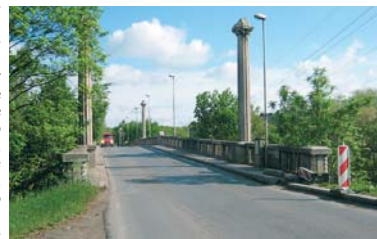
Opravy tohoto starého mostu v Jateční ulici by příští rok neměly dramaticky komplikovat dopravu na důležité komunikaci.