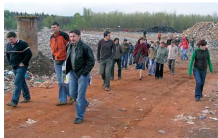
Účastníci školení absolvovali exkurzi na řízené skládce odpadů Vysoká u Dobřan. FOTO ŠKOLENÍ

Třetí blok série školení na téma „Vzdělávání a spolupráce v odpadovém hospodářství“ proběhl v hotelu Ve dvůře ve Spáleném Poříčí. Školení se účastnili zástupci obcí zapojených do projektu odpadového hospodářství Plzeňského a rovněž i Jihočeského kraje. Kromě nich absolvovali školení i projektoví asistenti, většinou studenti, kteří budou ve své obci realizovat vybrané aktivity v odpadovém hospodářství. Příkladem může být zajištění průzkumu mínění v obci na ochotu třídění odpadů, třídění biologických odpadů do samostatných nádob nebo příprava podkladů pro konkrétní projekt v odpadovém hospodářství, kterým se obec bude ucházet o finanční prostředky z Evropské unie.