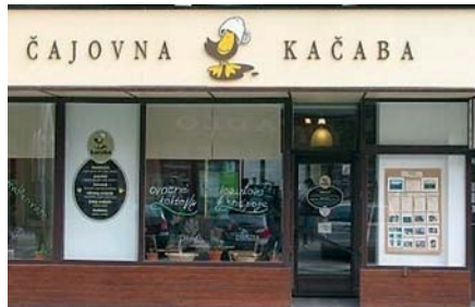
Kavárna a čajovna Kačaba vznikla díky dotaci v oblasti sociální integrace.

Plzeňský kraj se spolu s krajem Jihočeským na této dotační politice podílel výběrem projektů v rámci tzv. individuálních projektů ve Společném regionálním programu. „V Plzeňském kraji získalo podporu celkem 28 individuálních projektů v celkovém objemu 441,5 milionu Kč," uvedl radní pro regionální rozvoj Jiří Kalista. Mohlo tak vzniknout např. chráněné bydlení pro dospělé a děti postižené autis-