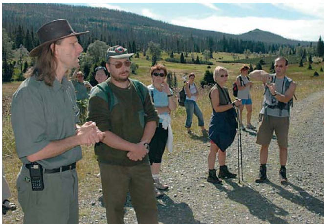
Loni směli turisté přejít vyjímečně po stezce vedoucí až na německou horu Luzný pouze v doprovodu pracovníků parku a jen po dobu pěti víkendů.