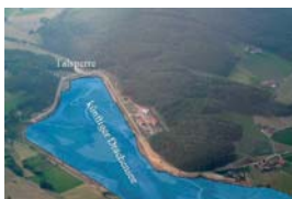
Takto bude vypadat Dračí jezero, které vyrůstá na německé straně hranice nedaleko od Všerub.