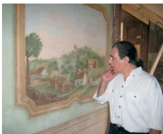
Pod tapetami nelepěnými vojáky se dochovaly vzácné fresky.

usídlila armáda. Nevhodné využití a provozní přetížení stavbu poškodilo. Po roce 1989 byl zámek metodistické církvi vrácen. Ta jej prodala soukromé firmě. Opravy, které zde prováděla, však byly zcela nekalifikované. Například byl zcela zbytečně odstraněn barokní krov a nahrazen ocelovým. Záměr společnosti zřítit zde špičkový hotel nevyšel a po několika letech se dostala do konkurzu. „Teprve současný vlastník přistupuje k úloze záchran architektonických i uměleckých hodnot objektu a jeho budoucího přeměněného využití zodpovědně. Dokládají to jak zatím realizované zásahy, tak celkový projekt a koncepce budoucích funkcí stavby. Dáří se mu realizovat jeho cíl, kterým byla záchrana určité památky,“ zhodnotil rekonstrukci prof. Mojim Horyna, ředitel Ústavu pro dějiny umění FF UK.