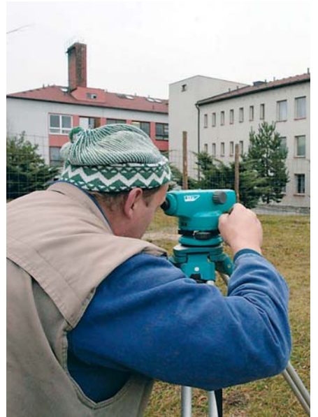
V Horní Brýze začaly koncem listopadu práce na stavbě nového pavilonu.

Především občanům postiženým Alzheimerovou chorobou a imobilním bude sloužit třípodlažní pavilon C, D v mirošovském ústavu. Ten by měl po přestavbě nabídnout 6 jednoúčelových nadstandardních pokojů a 6 dvouúčelových. Chybět nebudou ani centrální koupelny vybavené zvedáky a dalším zařízením pro nepohyblivé klienty a kompletní zázemí pro personál. „Původní projekt, podle nějž je vybudována hrubá stavba, počítal s vícelůžkovými pokoji, umakartovými jádry a dnes už nevyhovujícím prostoro-rovým členěním, zcela chyběly sklady a prostory pro sestry. Přistoupili jsme proto ke změně projektu i přestavbě. Naším prvotním cílem je poskytovat opravdu kvalitní péči,“ říká P. Karpíšek. Za letošní a příští rok tak Plzeňský kraj na investičních dotacích vyplatí Mirošovským šest milionů korun.