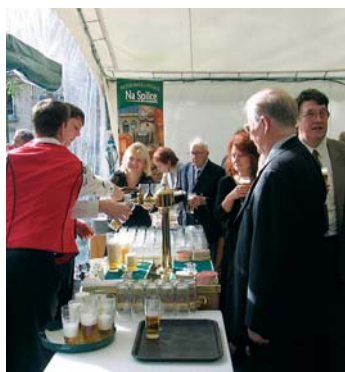
Nechyběla ochutnávka krajových specialit.

Prezentace a propagace Plzeňského kraje byla připravena a realizována ve spolupráci s Restauranem „Na Spilce“, Západočeským muzeem v Plzni, Plzeňským Prazdrojem, a. s., Bohemia Sektem, Českomoravskou vinařskou, a. s., Starý Plzeňec a Společností malíře Václava Brožíka z Třemošné.