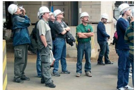
Učitelé v Německu získávali teoretické a zejména praktické zkušenosti s výukou vzdělávacích programů v oblasti automatizační techniky.

Kontaktní semináře umožnily poznat systém výuky odborných předmětů v učilišti v Německu a systém dalšího vzdělávání pracovníků v oblasti automatizační techniky. Účastníci nadnárodní výměny se aktivně podíleli na odborném semináři zaměřeném