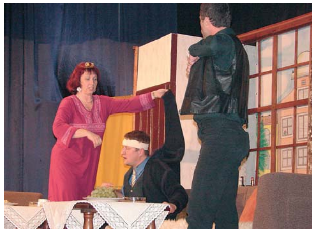
Komedii 1+1=3 zahájil 14. ročník Manětínské opony domácí soubor Mlask.

Historii tohoto zvláštního druhu umění mapuje také publikace Historie ochotnického divadla na severním Plzeňsku, na které coby odpovědný redaktor spolupracoval historik Muzea a galerie severního Plzeňska v Mariánské Týnici.