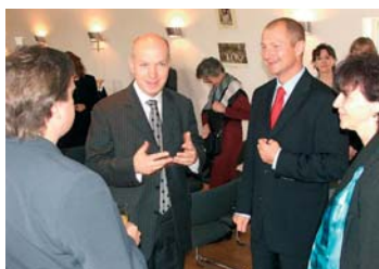
Představitelé Plzeňského kraje s velvyslancem ČR ve Francii.