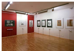
Kresby z plzeňského biennale jsou nyní k vidění v krásných prostorách galerie Sala Mansú v italském Bergamu.

„Jsem rád, že se Plzeňský kraj významně podílí svou podporou také na prezentaci Biennale kresby i mimo hranice Plzně a Plzeňského kraje formou putovních výstav v podstatě po celé Evropě. Biennale kresby tak dále aktivně šíří dobré jméno Plzně a Plzeňského kraje jako města a regionu vnímavého ke kultuře.“ uvedl krajský radní pro kulturu Martin Baxa. (RED)