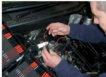
Součástí studia jsou i diagnostická měření motoru.