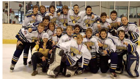
Hokejisté z výpravy Plzeňského kraje rozdrtili své soupeře a z olympiády přivezli zlato.