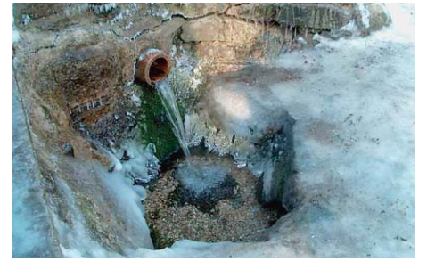
Pramen Prelátka léčil mnichy, hrabata i prostý lid.