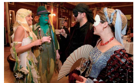
Vodník přišel samozřejmě s ruskou.