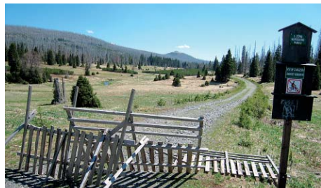
Šumava bohužel stále zůstává uzavřenou oblastí.

O větší propustnost hranice usiluje Svaz obcí Národního parku Šumava za podpory Plzeňského i Jihočeského kraje a Klubu českých turistů. Důvodem je skutečnost, že ani po vstupu naší republiky do schengenského prostoru nemohou lidé volně překračovat hranici, protože k ní v dlouhém úseku přiléhají chráněná území, kam je vstup zakázán z důvodu ochrany přírody. Průchodnost hranic však považují české i bavorské obce za hlavní impuls k rozvoji tohoto území. Proto navrhují zříditi celou řadu stezek, umožňujících přechod hranice.