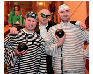
Věžské koule při tanci asi musely trošku vadit.