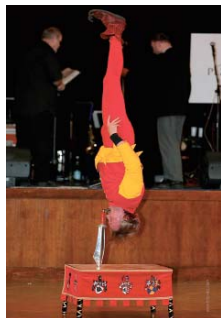
Artista prováděl neuvěřitelné věci.

V tajemném, ale velmi veselém duchu se odehrál tradiční ples Plzeňského kraje v Měšťanské besedě. Hosté mohli po celou dobu zůstat nepoznání a bavit se zcela inkognito. Ples byl totiž maskami a nejen na tanečním parketu, ale i ve všech prostorách Měšťanské besedy se proháněla nejrůznější strašidla, pohádkové bytosti, zvířátka a další fantastické postavy. Nechyběli upíři, vodníci, víly, dvorní dámy, námořníci, čerti, princezny, skupinka uprchlých trestanců nebo kaspárek. Arabský šejk vytácel na parketu bílou paní, kardinál zase abatyši, kočič muž kočič ženu. Pokud přišel někdo z návštěvníků plesu bez masky, mohl si hned u vchodu vybrat z několika druhů skrabošek. Ve