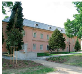
Muzeum příhraničí ve Kdyni sídlí v krásném objektu.

Jednotlivé soutěžní projekty hodnotí odborná sedmičlenná porota nezávislých odborníků, kterou jmenovali vyhlásovatelé soutěže. Porota hodnotí nejen odbornou úroveň expozice. Přihlašovaatel musí také splnit celou řadu dalších kritérií, například míru a dobu zpřístupnění objektu, způsob propagace, existenci doprovodných programů, kvalitu