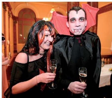
Úžasná dvojice upíra získala cenu za nejlepší masky.