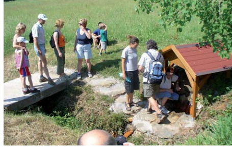
U Studánky lásky stojí lidé mnohdy i ve frontě.