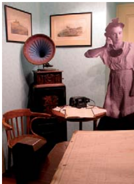
Expozice muzea má návštěvníkům co nabídnout.

Muzeum příhraničí ve Kdyni bude bojovat v 6. ročníku Národní soutěže muzeí Gloria musealis, kterou vyhlašuje Ministerstvo kultury ČR a Asociace muzeí a galerií ČR. Tato soutěž má přispět ke všeobecnému zvýšení prestiže muzejních institucí a posílení obecného chápání smyslu jejich existence jako strážců významné části národního kulturního dědictví. Soutěžním projektem může být jakákoliv aktivita muzea, pokud byla završena v období od 1. ledna 2007 do 28. února 2008. Gloria musealis je vyhlášována celkem ve třech kategoriích. Muzeum příhraničí ve Kdyni bude zařazeno do kategorie Muzejní počín roku. Podmínkou účasti v soutěži je zápis muzejních sbírek do centrální evidence sbírek (CES). Jelikož Muzeum příhraničí ve Kdyni tuto