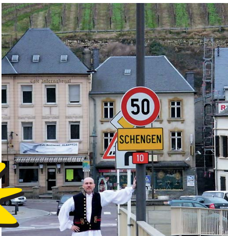
Víte, ve které zemi leží městečko Schengen?