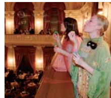
Vily s bublinkami.