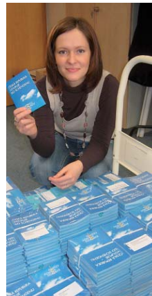
Plzeňský kraj pomohá distribuovat tyto brožury s cennými informacemi o Schengenu.

Odpovědi zasilte na adresu redakce Plzeňský kraj, Husova 29, Plzeň, 301 00. Vylousování výherce bude odměněno.