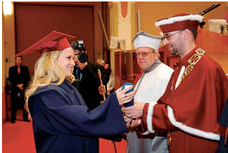
Promoce je i pro studenty Metropolitní univerzity nezapomenutelným zážitkem.

kalářských, 4 magisterské a 1 doktorský obor. Atraktivní jsou zvláště obory Mezinárodní vztahy a evropská studia, Veřejná správa, Mezinárodní obchod a také Humanitní studia. Ale velmi zajímavý je speciální právní obor Ochrana průmyslového vlastnictví. Nejen pro učitele anglického jazyka je určen nový obor Anglofonní studia.