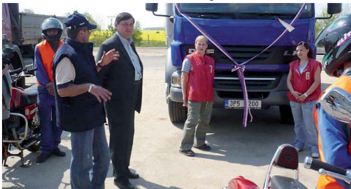
Nové výcvikové vozidlo předal borské škole náměstek hejtmána Plzeňského kraje Václav Červený.