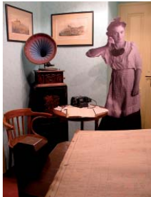
Originální expozice muzea ve Kdyni má návštěvníkům co nabídnout.

Do všech soutěžních kategorií (výstava, publikace, počin) se přihlásilo celkem 50 muzeí a galerií se 171 soutěžními projekty. Sedmičlenná odborná porota navštívila všechny přihlášené projekty osobně. Po posouzení všech předepsaných kritérií udělila v každé kategorii první tři místa a zvláštní ocenění. To dostalo i Muzeum Chodská v Domažlicích a město Kdyně. „Stála expozice ve Kdyni zaznamenává podle