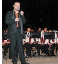
Dechový orchestr mladých pozdravil radní Plzeňského kraje Martin Baxa.