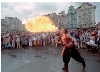
Kejklíři vždy pobaví.