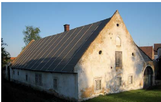
Selský dvůr v Plzni-Bolevci je novou národní kulturní památkou.

V Plzeňském kraji je dalších 15 národních kulturních památek. Na Domažlicku je to kostel sv. Mikuláše v Čechovicích a areál zámku v Horském Týně. Na