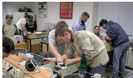
V SOUE vychovávají odborníky, o které mají zájem kvalitní firmy.

Myslenku vzniku odborných a aktuálních skript podpořil Elektrotechnický cech Plzeňského regionu. Členové cechu a někteří další potenciální zaměstnavatelé