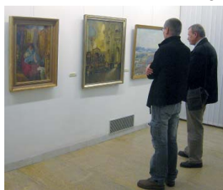
Západočeská galerie v Plzni by se mohla dočkat i dalších zajímavých děl ze zahraničí.