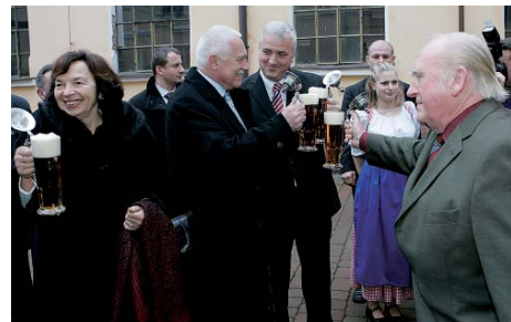
Pivo se pilo tentokrát v pivovaru v Chodovské Planě.

„Bylo hezké, že si pan prezident udělal čas v hektické době před volbami a přijel na svoji druhou návštěvu Plzeňského kraje. Všude byl vítán stovkami lidí, což je důkaz toho, že prezident