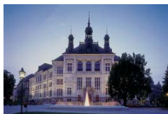
Západočeské muzeum v Plzni chce vybudovat ucelenou expozici mapující dějiny našeho kraje.

Muzea mají v plánu za pevně předemšví vybudovat nebo obnovit své expozice, některá počítají i se stavebními úpravami budov. Pomalu se blíží ke konci stavební obnova objektů muzeí a galerií. Dnes je pro nás významným a velkým tématem obnovení nebo zřízení stálých expozic,“ vysvětlil Martin Baxa, krajský radní pro oblast kultury. Největší projekt se žádostí o podporu hodlá předložit právě Západočeské muzeum v Plzni. Pomalu v něm končí mnohaletá rozsáhlá a nákladná rekonstrukce objektu. „Plánovaná moderní expozice nebude spolehat jen na atraktivní sbírkové předměty vystavené ve vitrinách, ale využije k jejich prezentaci moderní interaktivní metody, projekce a podobně. Během několika let by měla být postavena kompletní expozice mapující dějiny západních Čech od pravěku až