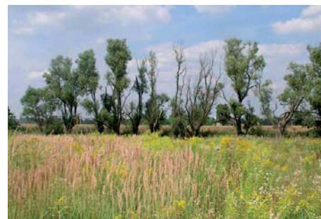
Ochrana přírody by měla být prvořadým zájmem každého z nás.

V této fázi připravuje soustavu NATURA 2000 je vyhlášen Operační program Životní prostředí na projekt Implementace a péče o území soustavy NATURA 2000. Z Fondu životního pro-