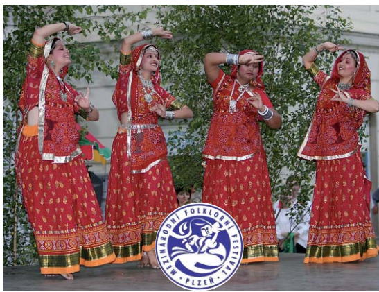
Folklorní festival v Plzni hostí tradičně i soubory ze zahraničí. Byly mezi nimi i tanečnice z Indie.