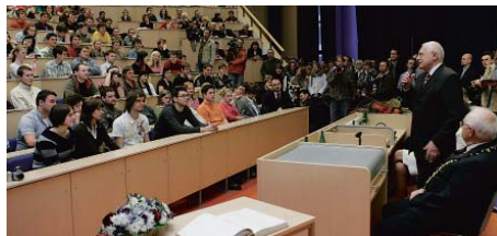
Ve zcela zaplněné posluchárně ZČU v Plzni diskutoval Václav Klaus se studenty.