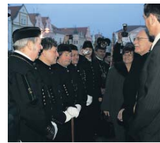
Ve Stříbrně defilovaly městské spolky.

Zmínil bych však jednu věc, která mě mrzela. A oficiální zahájení návštěvy prezidenta v Krajském úřadu Plzeňského kraje i na slavnostní večeři pořádanou krajem byli pozváni