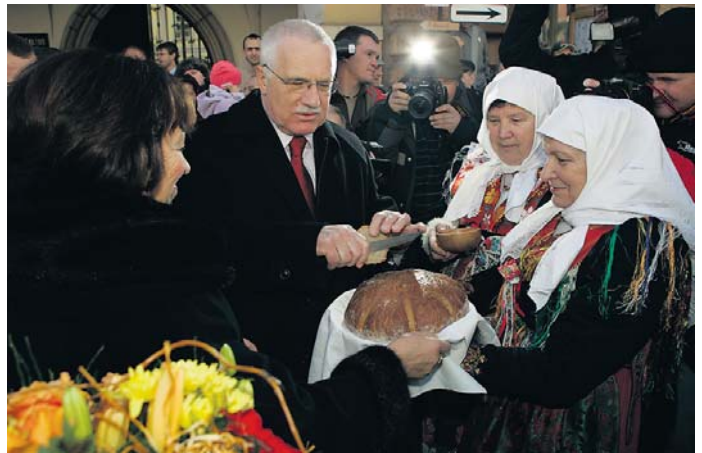
Domažličtí vítali prezidenta chlebem i solí.

Další podrobnosti o návštěvě prezidenta v kraji na straně 8