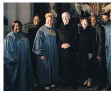
V Kladruzech se prezidentský pár vyfotografoval s americkým gospelovým souborem, který překrásně zazpíval.