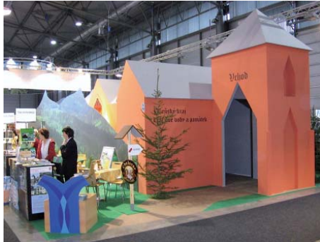
Stánek Plzeňského kraje byl stylizován jako chrám.

Již potřetí se Plzeňský kraj na Regioutouru v Brně snažil zaujmout něčím jiným, něčím zcela odlišným. Zda se to podařilo, musí posoudit někdo jiný. Ale zkusím naše čtenáře touto expozicí provést právě tak, jako průvodce ukazuje náš krásný kraj. Vítá nás stolec s nabídkou čerstvých vod z našich studánek, konkrétně se jedná o minerální vodu z Prusíkova pramene z Konstantinových Lázní, železitou vodu ze studánky v Dobré Vodě či o proslavený pramen Prelátka, jinak nazývaný Prskavka, které oběťve zajistili vystavující partneři Plzeňského kraje. Vodu nalévá pohádková vila a přidává i nový propagační materiál – skládku vod představující známé i zapomenuté studánky v kraji. Z lúna Šumavy na nás shlíží sv. Jan Nepomucký, patron vod, a my vycházíme do chrámu přírody, ale i chrámu památek. Z muraire