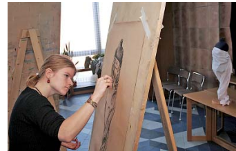
Žáci uměleckých oborů pracovali v improvizovaném ateliéru.

Prezentační akce SOŠ Plzeňského kraje se již tradičně konala v lednu v plzeňském DK Inwest. Zúčastnilo se jí více než 30 středních škol z Plzeňského, Karlovarského a Jihočeského kraje. Akci zahájil Václav Červený, náměstek hejtmána PK pro oblast školství, mládeže a sportu. Žáci ZŠ spolu se svými rodiči a široká veřejnost se mohli seznámit s ukázkami prací žáků, zhlédli různé praktické činnosti, např. vazbu květin, aranžování, nádherně prostřené stoly, soutěžní pánské a dámské účesy, úžasně líčení mladých dam ve stylu 30. let. Žáci a žákyně uměleckých oborů zručně malovali podle předlohy, oděvaři měli připravené nápadité módní přehlídky a žáci stavebního učiliště předvedli nabyté dovednosti z jednotlivých oborů. Rada škol se prezentovala formou stánků, u kterých obdrželi zájemci vyčerpávající informace o skladbě nabízených oborů, mohli si prohlédnout výrobky žáků, které vznikaly v hodinách praktického vyučování, a též si je mohli zakoupit. Mezi tyto výrobky