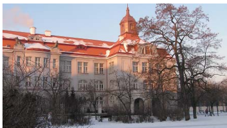
Plzeňské gymnázium na Mikulášském náměstí vychovává vynikající studenty.

„Některé projekty studentů a učitelů školy překročily rámec republiky. Mezinárodní konference o využití výpočetní techniky ve výuce se konala pod přímou patronací I. náměstka hejtmána Václava Cerveného. Ten současně upozornil ministra kultury na projekty Pokoj 127 a Spolužáci. Jejich kvalita zaujala ministra natolik, že se rozhodl pro jejich částečné financování z vlastního fondu,“ dodal ředitel Trneček.