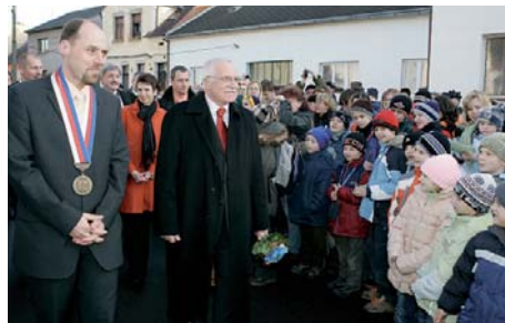
Prezident byl doslova na každém kroku v obležení veřejnosti.