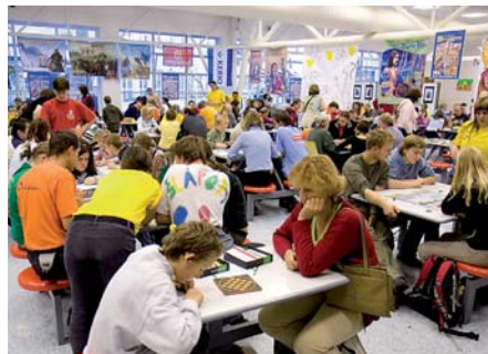
V Nepomuku hrdí hry mali i dospělí bez rozdílu věku.

Mali i dospělí milovníci deskových her bez rozdílu věku si dali o víkend 10.–11. 11. 2007 dostaveníčko v základní škole v Nepomuku. Na druhý ročník festivalu deskových her nazvaného David a Goliáš, který organizovalo občanské sdružení GOADA dorazilo celkem 700 návštěvníků. A podle nadšených reakcí se všichni královsky bavili. O hráče se staral čtyřicetihlavý organizační tým, který vedle členů sdružení GOADA tvořili také členové plzeňských klubů Tírga a Bedna. Počet her prezentovaných na festivalu se tentokrát přiblížil dvěma stovkám. Sve stánky zde měli také čeští distributori des-