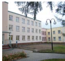
Nově rekonstruovaný pavilon C, D.