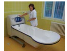
Nepohybliví obyvatelé na invalidních vozíčkách mají k dispozici speciální vanu, která jim umožní snadnější přístup ke koupání.

Služby obyvatelům zařízení zajišťuje 188 zaměstnanců. Na jaře v domově vzniklo aktivizační centrum, jehož cílem je zajišťovat pro klienty mimočasové aktivity a kulturní program. „Nabízíme jim například muzikoterapii, čtení i další služby takzvané šité na míru. Nejvíce klientů přichází do Mirošova z Plzeňského