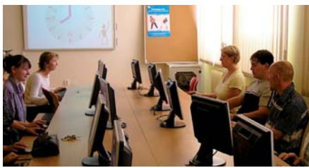
Pedagogičtí pracovníci gymnázia se učí, jak sestavovat vlastní výukové programy.

Do projektu 3. výzvy grantového schématu zkvalitňování vzdělávání ve školách a školských zařízeních se úspěšně zapojilo Sportovní gymnázium Plzeň, Táborská 28. Vedení školy předložilo projekt Modernizace školských vzdělávacích programů (ŠVP). Tento projekt