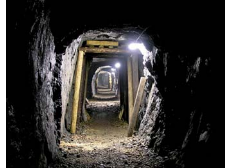
Návštěva štol Prokop je nevdědním zážitkem.

A co vše je ve skanzenu k vidění? V celém areálu je možno zhlédnout různou důlní techniku používanou dříve jak ve stříbrském revíru, tak i v ostatních revírech celé České republiky. Důlní vozy, vrtací kladiva, různé typy okových, hydraulických a mechanických výklopníků, důlní nakladače různých typů, vrtací soustavy a mnoho dalších již historických exponátů doplňuje funkční důlní lokomotiva a replika stoly, kde je možno názorně zhlédnout použití zmíněné techniky při těžbě. Dále se v areálu nachází i vstup do tzv. průzkumné štol (bývalého skladiště dřevních trhavin) ve které se návštěvníci seznámí