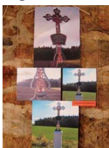
Díky dotaci Plzeňského kraje se k cestám u obcí vrací i křížky.

ulici. Panely s fotografiemi zachycují celou řadu památek, které se daří zachraňovat i díky stědrým dotacím Plzeňského kraje, jež jsou každoročně udělovány vlastním objektům. Výstava mapuje záchranu tvrze ve Lstění, kostela v Křivčicích, zámku v Týnci, obnovu stropu hradu v Prostiboři, obnovu usedlosti a roubených chalup v Kamenném Újezdě, v Medově Újezdě a v obci Stvolý. Zajímavostí je také vrácení mnoha křížků a křížů k cestám u Lužniček a u obce Nečtiny. „V rámci programů na zachování a obnovu kulturních památek Plzeňského kraje a obnovu historického fondu v památkových rezervacích a zónách se na rok 2007 posuzovalo celkem 300 žádostí o dotace. Plzeňský kraj odsouhlasil a následně i poskytl 101 dotací na památky a 74 dotací na objekty v zónách i na drobnou architekturu. Vlastníkům objektů přispěl Plzeňský kraj na obnovu historické