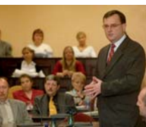
Ministr Petr Nečas besedoval v sídle Plzeňského kraje o změnách v zákoně o sociálních službách.

Stovka osob přišla do budovy Krajského úřadu v Plzni na besedu s ministrem práce a sociálních věcí Petrem Nečasnem, který navštívil náš region. Naprostá většina účastníků besedy pracuje v sociální sféře, a proto je zajímavým hlavně plánované změny v zákoně o sociálních službách. Česká společnost rychle stárne, a do sociální sféry bude proto postupně proudit více peněz. Sociální služby v následujících letech čeká znatelný rozvoj, zákony musí být ale upraveny tak, aby se vložené peníze využily efektivním způsobem. To byl hlavní okruh témat, kterými se ministr Nečas na setkání zabýval. „Kvalifikační požadavky pro poskytovatele sociálních služeb jsou dost vysoké, budeme usilovat o změkčení. Od ledna už přijdou první změny. Na druhé straně chceme zachovat tlak na neustálé vzdělávání sociálních pracovníků,“ naznačil při setkání jednu ze změn v zákoně ministr Petr Nečas. (BEI)