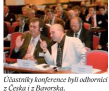
Účastníci konference byli odborníci z Česka i z Bavorska.