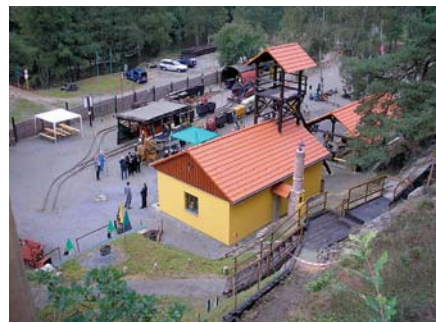
Hornický skanzen ve Stříbře má i zajímavou venkovní expozici.