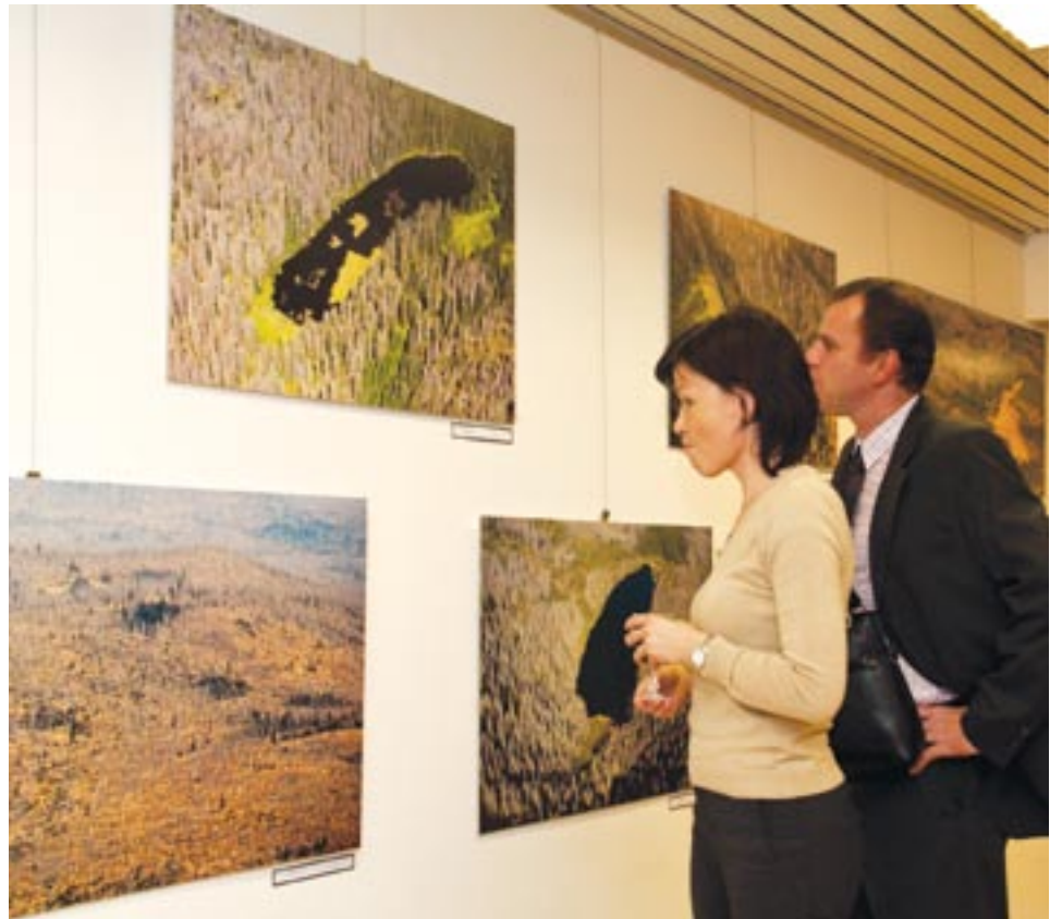
Návštěvníci Českého centra v Bruselu si prohlížejí výstavu Zachraňme Šumavu.

Fotografie Milana Váchala a Zdeňka Troupa dokumentují změnu krajinného rázu Šumavy se všemi jejími důsledky. Ukazují pohledy na krásné zelené plochy