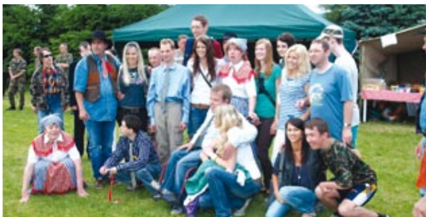
Snímek, který vznikl při letním Sportovním dni. Pro klienty domova byl připraven pestrý program, pozdravit je přišly i finalistky soutěže Dívka Šumavy.

V současné době v bystřickém domově probíhá druhá etapa rekonstrukce, která zahrnuje například vybudování nového bezbariérového vchodu a kontaktní místnosti pro návštěvy a rodiče. „Smyslem celé rekonstrukce je, aby naši klienti měli takové zázemí, které odpovídá standardu a co nejvíce připomíná běžné domácí prostředí. Měla by také zásadně přispět ke zlepšení pracovních podmínek zaměstnanců. Rekonstrukce za plného provozu vyžaduje od všech velkou míru trpělivosti, tolerance a schopnosti se přizpůsobit,“ podotýká ředitelka.