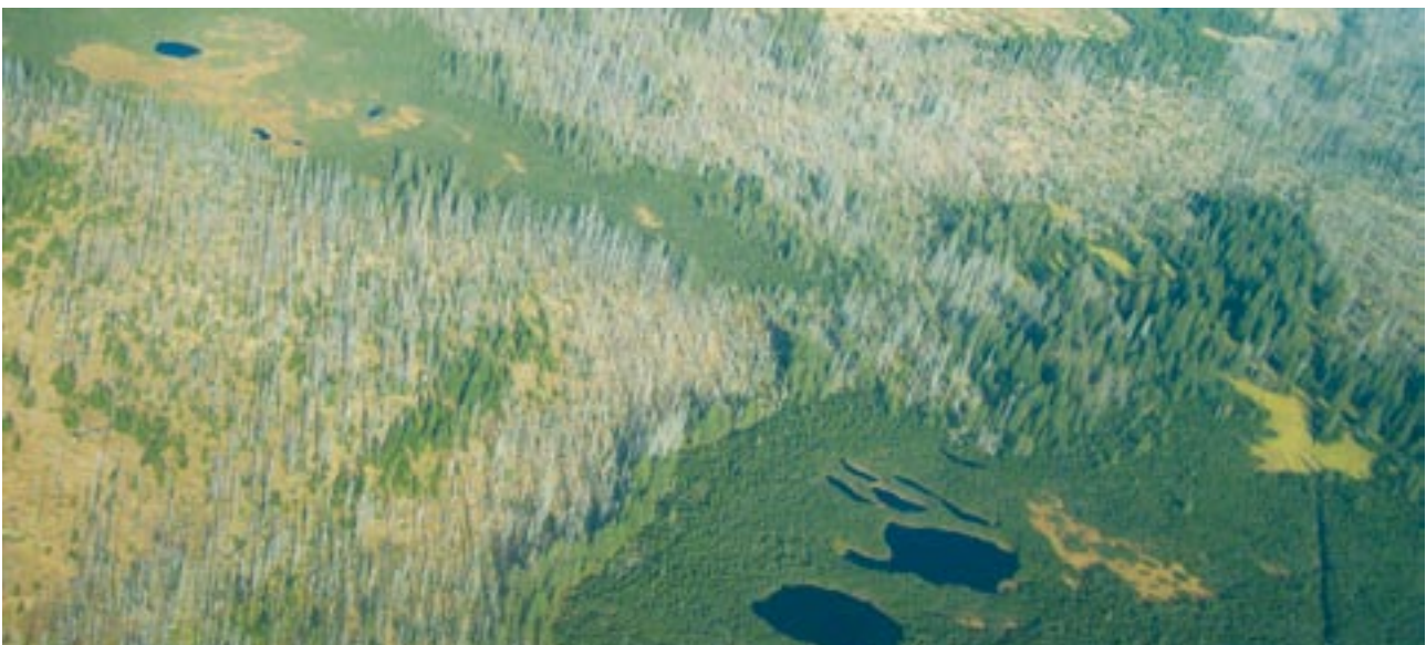
Letecký snímek z konce září ukazuje, jak se kůrovec podepisuje na některých šumavských lokalitách.