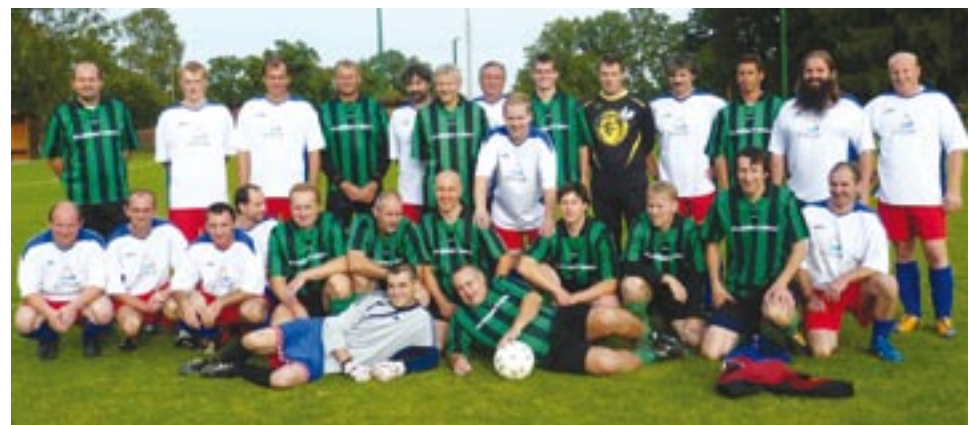
Společné foto před zápasem. Chanovická Stará garda nastoupila v bílých dresech, tým krajského úřadu v tradiční zelenočerné kombinaci.

Fotbalové mužstvo krajského úřadu Plzeňského kraje je tvořeno především zaměstnanci úřadu a podle potřeby doplňováno hosty, kteří s institucí úzce spolupracují. Věkový průměr týmu se pohybuje kolem čtyřiceti let.