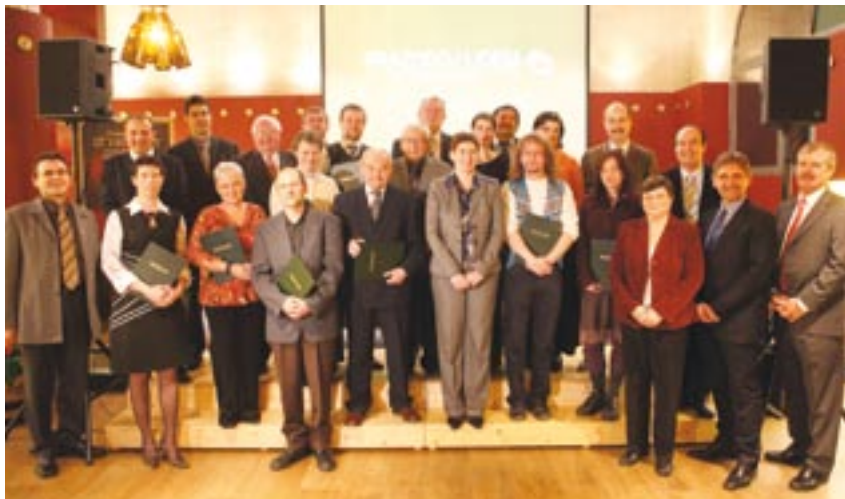
Společný snímek členů Rady reprezentantů a zástupců neziskových a příspěvkových organizací, které se svými projekty uspěly v loňském ročníku programu Prazdroj lidem.

Program Prazdroj lidem za uplynulých osm ročníků rozdělil mezi 111 projektů více než 32 milionů korun.