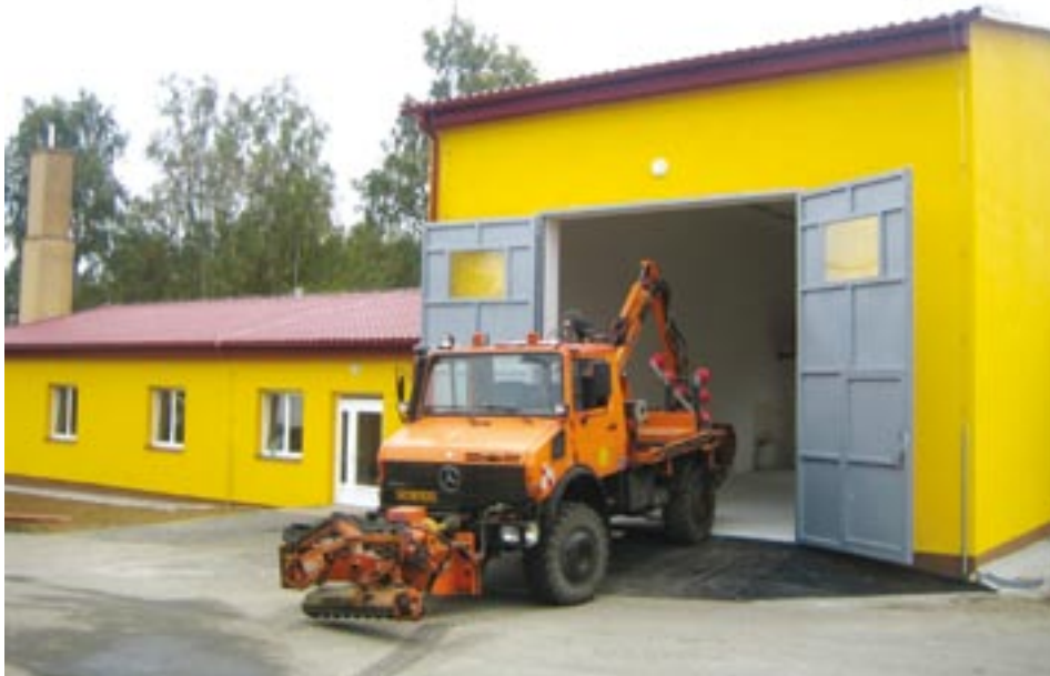
Středisko Správy a údržby silnic Starý Plzenec ve Dvorci u Nepomuka získalo nový provozní objekt.

Pracovníci dvoreckého střediska zajišťují na Nepomucku po celý rok opravy a údržbu silnic druhé a třetí třídy, které jsou majetkem Plzeňského kraje. Kromě toho se starají také o úseky důležitých státních silničních koridorů první třídy I/19 a I/20, které spojují Plzeňsko, Strakonicko a Příbramsko.