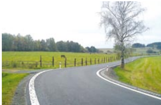
Opravený úsek silnice II/191 mezi obcemi Petrovičky a Petrovice na Klatovsku.

● Silnice II/191 Petrovičky – Petrovice. Tato oprava stála zhruba 16,5 milionu korun.