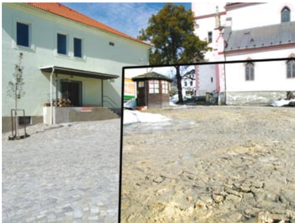
Tato fotomontáž ukazuje, jak se díky rekonstrukci změnil povrch kašperskohorského náměstí.

bí třicetileté války. Archeologický výzkum za šest milionů korun i zbývající náklady na druhou etapu rekonstrukce náměstí uhradilo ze svého rozpočtu město Kašperské Hory.