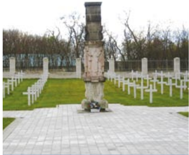
Italský vojenský hřbitov v Milovicích u Prahy, kde se každoročně 4. listopadu u příležitosti italského vojenského svátku pokládají věnce. Takto rozsáhlý italský vojenský hřbitov se na území Plzeňského kraje nenachází.

724 333 749 nebo e-mailové adrese milan.jencik@plzensky-kraj.cz.