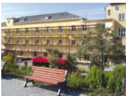
Modernizace bystřického domova by měla být dokončena v roce 2011.

Bystřický domov je příspěvkovou organizací Plzeňského kraje. Jedná se o pobytové zařízení s celoročním provozem. „Staráme se o osoby s mentálním postižením a kombinací vad ve věku od 3 do 64 let. Pobytové služby zahrnují stravu, ubytování, zvládání základních úkonů péče o vlastní osobu, vzdělávání, výchovu, kulturu, pracovní činnosti a mnoho dalších aktivit, které jsou součástí běžného života rodiny vychovávající své děti. Naše zařízení je rodinou pro 148 uživatelů,“ říká ředitelka Kateřina Šimková.