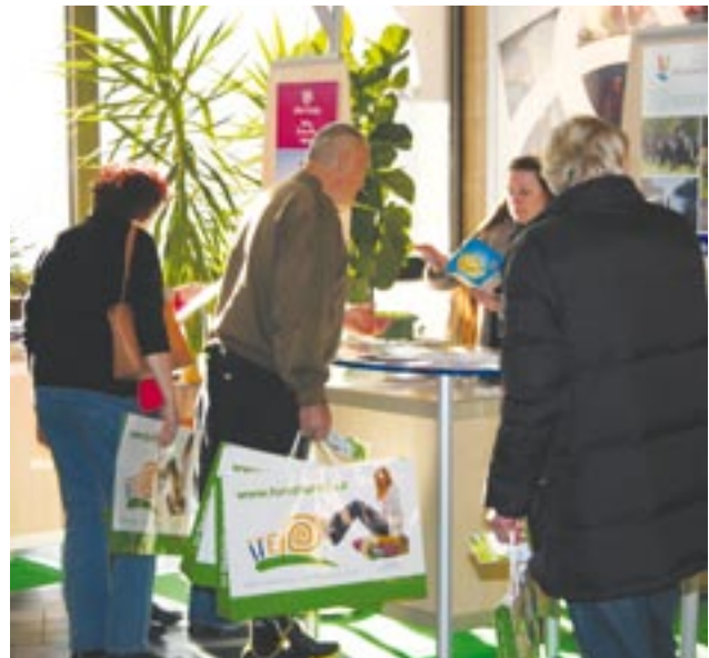
Návštěvníci veletrhu ITEP si domů odnášeli celou řadu zajímavých propagačních materiálů.

V rámci veletrhu byli slavnostně vyhlášeni vítězové letošní Prázdninové štafety, velkého soutěžního putování po turistických zajímavostech Plzeňského kraje pro děti a mládež. Akcí společně připravily Plzeňský kraj a plzeňská ZOO. „Obdrželi