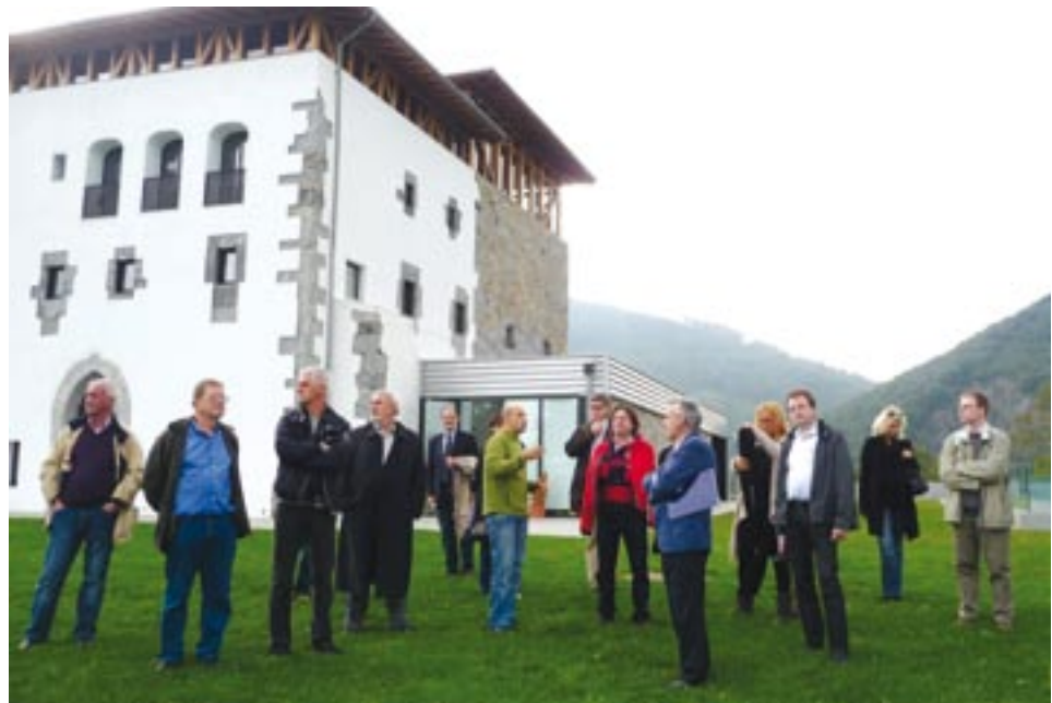
Součástí jednání řídicí skupiny ENCORE v Bilbau byla také návštěva Euskadi centra biodiverzity, které se nachází v nádherné rezervaci Urdaibai.

Velice zajímavou součástí baskického jednání byla návštěva Euskadi centra biodiverzity. To se nachází v nádherné