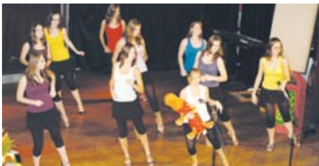
Masarykovo gymnázium v Plzni je devadesát let. Součástí oslav tohoto významného jubilea byla také žákovská akademie. V pondělí 1. listopadu ji hostil kulturní dům Peklo.

Základní a Odborná škola Horšovský Týn je na Domažlicku známá především díky krásným výrobkům svých žáků. Jedná se například o keramiku či aranžované květiny. Velice oblíbené jsou prodejní velikonoční, dušičkové i vánoční výstavy.