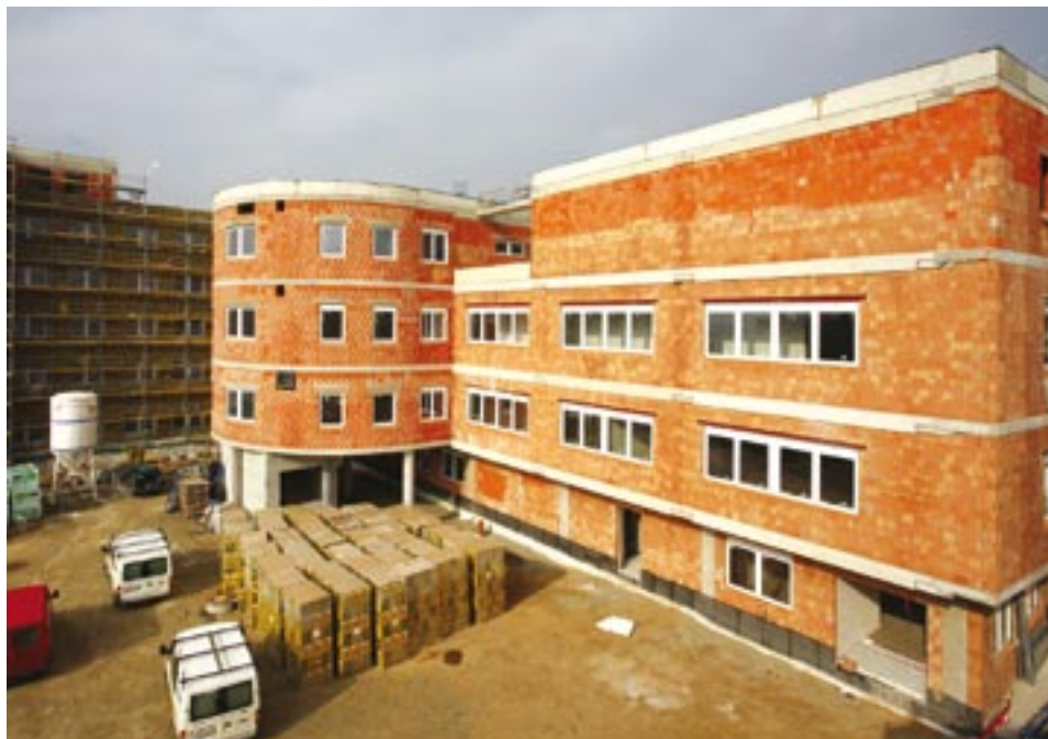
Výstavba nemocnice v Klatovech patří mezi projekty, které budou finančně podpořeny Evropskou unií v rámci 5. výzvy Regionálního operačního programu Jihozápad.

na vybudování nové mateřské školy,“ konstatuje Jiří Struček, člen regionální rady a náměstek hejtmana Plzeňského kraje pro oblasti školství, mládeže a sportu. Kompletní seznam podpořených projektů je zveřejněn na internetové adrese www.rr-jihozapad.cz .