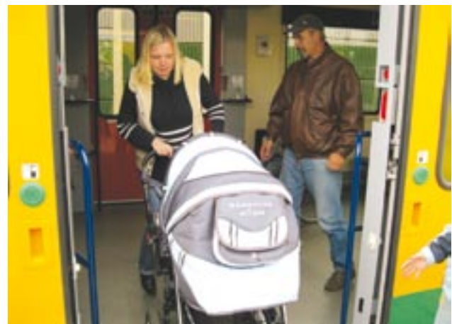
Prezentační jízdy Plzeňské linky přilákaly také řadu maminek s dětmi. Díky modernímu nízkopodlažnímu vozidlu Regionova nepředstavovalo nastupování a vystupování s kočárkem žádný problém.

Možnost vyzkoušet si Plzeňskou linku přilákala především seniory a maminky s dětmi. Cestující oceňovali nejen praktičnost spoje, ale také komfort, který nabízí moderní nízkopodlažní vozidlo Regionova. Snadno se do něj nastupuje, sedadla jsou pohodlná, na bezbariérové toaletě najdou maminky i přebalovací pult a v soupravě je