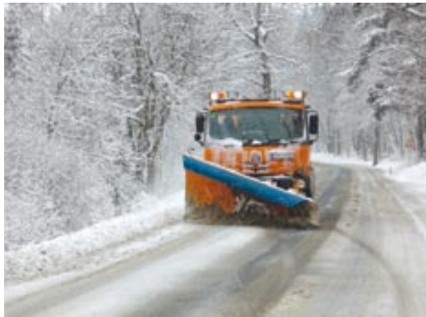
Loňská zima byla z pohledu údržby komunikací velice náročná. Silničáři se museli vypořádat s velkým množstvím sněhových přeháněk, častý byl silný nárazový vítr.

V našem kraji je celkem 5020 kilometrů silnic první až třetí třídy a 110 kilometrů dálnice. Zimní údržba se provádí podle předem stanoveného plánu, který schvaluje ministerstvo dopravy. Zahrnuto do něj není pouze 190 kilometrů silnic, jejichž dopravní význam je minimální. „Jedná se o některé úseky silnic třetích tříd, které nevyužívá veřejná doprava a nejsou jedinou přístupovou