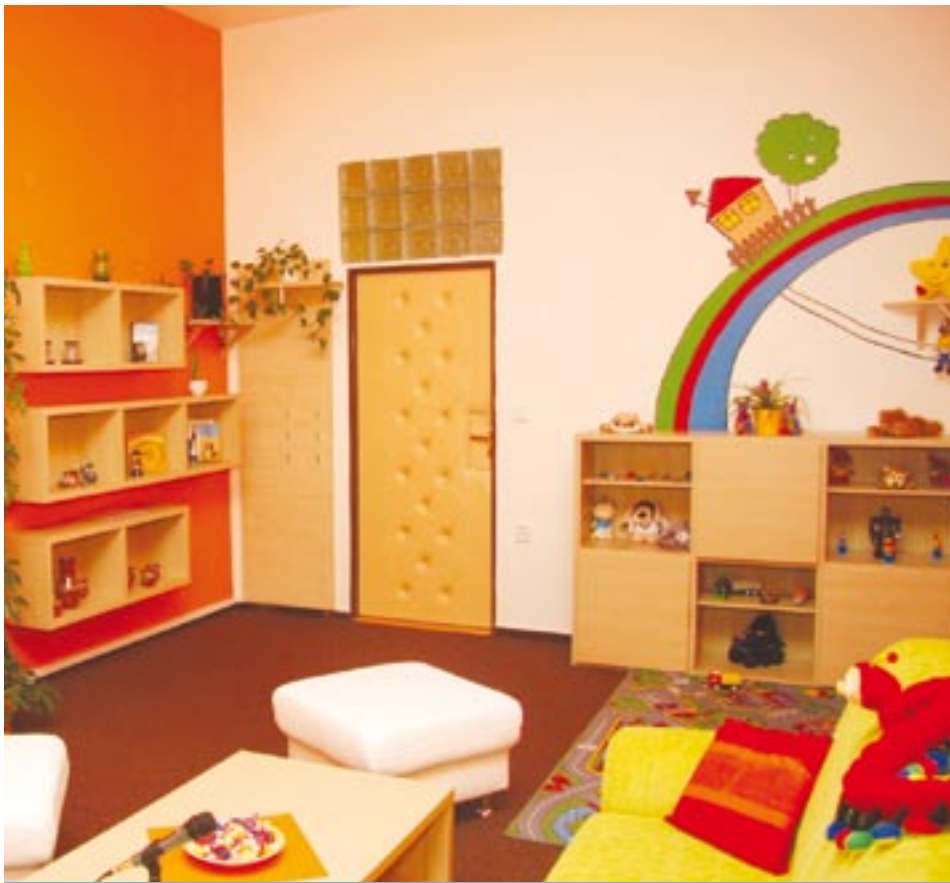
Moderní výslechové místnosti pro dětské svědky a oběti trestné činnosti fungují již v několika městech České republiky. Takto vypadá například výslechová místnost v Opavě.

Už v lednu příštího roku by měly být v Plzeňském kraji v provozu dvě nové speciální výslechové místnosti pro dětské svědky a oběti trestné činnosti. První z nich je v těchto dnech budována v areálu Fakultní nemocnice Plzeň-Bory, druhá v Klatovské nemocnici. Projekt společně realizují Policie ČR a Plzeňský kraj.