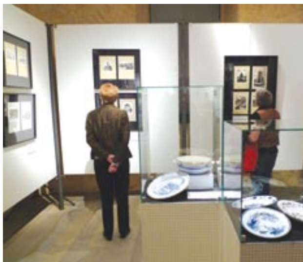
Výstava nazvaná Vergessenes Erbe – Zapomenuté dědictví představila v bavorském městě Schönsee tvorbu deseti německých výtvarných umělců, kteří pocházejí z Plzeňského kraje.

V rokycanském muzeu se ve dnech 19. až 21. října uskutečnil již šestý ročník vědecké konference na téma historie a současnost železářství a železářské výroby. Odborníci z České republiky, Slovenska, Rakouska, Německa a Ruska připravili řadu zajímavých příspěvků, které byly novány například kovohutnictví a železářským provozům v rokycanském regionu, významným železářským rodům v Čechách i na Slovensku, problematice vztahu železářství a surovinové základny pro výrobu, dějinám ovočkářství na Podbrdsku, umělecké litině či železným uměleckým plastikám ve sbírkách muzeí. Součástí akce byla také exkurze do firmy Zbirovia Zbiroh, návštěva vodního hamru v Dobřívě, výstavy umělecké litiny na zámku v Hořovicích či sbírek slévárenského muzea v Komárově. Vědecká konference se konala pod záštitou Plzeňského kraje.