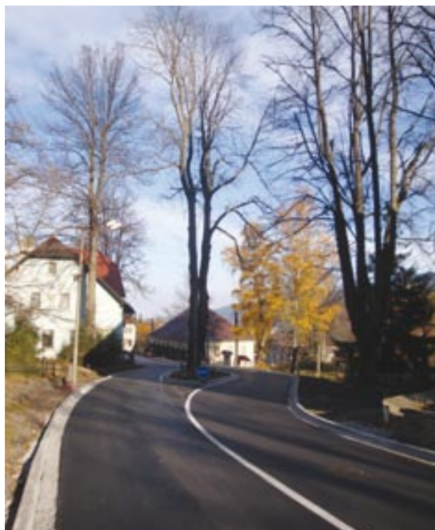
Rekonstrukce průtahu obcí Hojsova Stráž na Klatovsku trvala tři měsíce. Snímek je z přelomu října a listopadu. Tehdy už byla hotová silnice, zbývalo ještě dokončit chodníky.