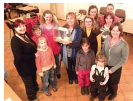
Výtěžek z dobročinného jarmarku, který uspořádala Síť mateřských center Plzeňského kraje, putoval na podporu plzeňské Poradny pro ženy a dívky.

informací o poradně najdete na internetové adrese www.poradnaprozeny.eu .