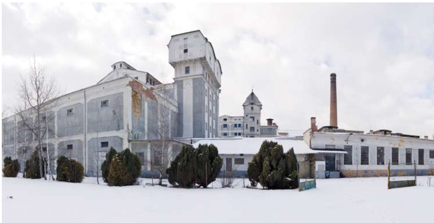
Jeden z nejatraktivnějších brownfieldů se nachází v Plzni na Světovaru. V areálu nejdříve sídlil pivovar, poté armáda, několik let byl opuštěný. Nyní se schyluje k jeho revitalizaci.

Určitě je to areál bývalých kasáren ve Stříbře. Na toto město na Tachovsku dopadla ekonomická krize hodně silně, v jednu chvíli zde byla nezaměstnanost nad dvaceti procenty. Ve spolupráci s městem jsme se snažili situaci co nejrychleji vyřešit. Do Stříbra jsme lákali investory opravdu silně, inzerovali jsme například v odborných časopisech. A snaha přinesla ovoce, v současnosti jsou v areálu bývalých stříbrských kasáren první investoři a o příchodu dalších se jedná. Velice nás těší i průběh revitalizace areálu bývalých kasáren v Plzni na Světovaru. Městu se podařilo vykoupit všechny pozemky a už je zpracovaná i studie jejich využitelnosti. ■