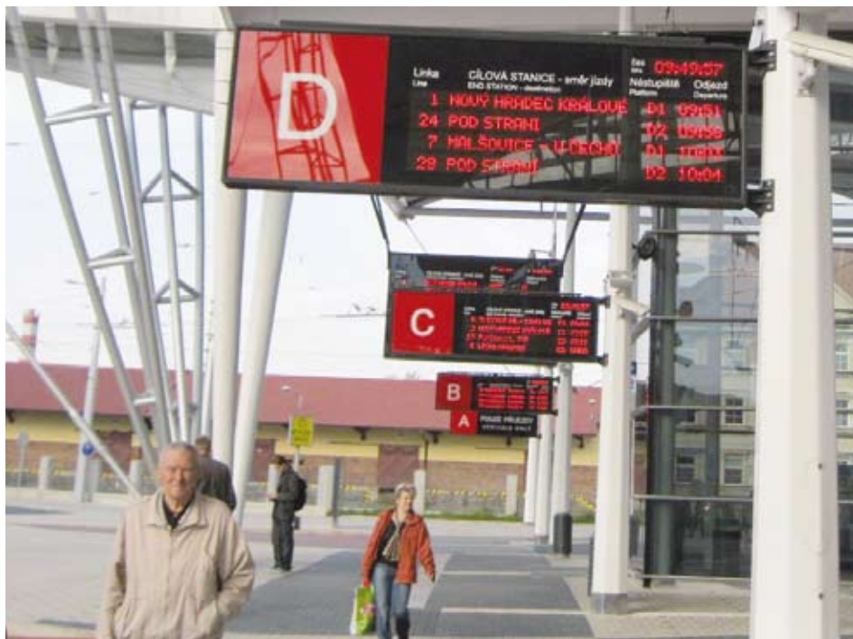
Informační panely jsou v provozu na několika místech České republiky. Tento snímek je z Hradce Králové.

vat časy odjezdů jednotlivých druhů veřejné dopravy. Stane se tak v rámci projektu s názvem Zvýšení kvality veřejné dopravy