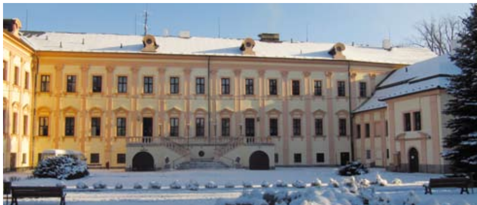
Liblínský domov sídlí v barokním zámku, který je obklopený rozlehlým parkem.