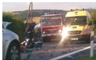
Posádky Zdravotnické záchranné služby Plzeňského kraje často vyjíždějí také k dopravním nehodám. Tato se odehrála v serpentínách u Plas na severním Plzeňsku.