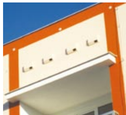
Typizované budky pro rorýse obecné jsou nenápadně umísťovány přímo do zateplení budov.

Rorýs obecný je rozšířen v široké oblasti od Evropy až po jezero Bajkal a Mongolsko. Kdysi hnízdil ve skalách či dutých stromech, lidské stavby začal využívat zhruba před sto lety. Je to tažný pták, který zimuje až na jihu od rovníku v Africe. Na zimoviště od nás odlétá již v srpnu, v dubnu se vrací.