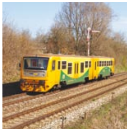
Počet železničních tratí v Plzeňském kraji, na nichž zajišťují přepravu cestujících zrekonstruované částečně nízkopodlažní soupravy Regionova, se každým rokem zvyšuje.

du je plánovaná linka na trase Kozolupy – Vochov – Plzeň-Křimice – Plzeň-Zadní Skvřiny – Plzeň-Jižní předměstí – Plzeň hlavní nádraží – Starý Plzenec – Štáhlavy – Nezvěstice – Zdemyslice – Blovice revolučním projektem. Jeho realizaci již schválila Rada Plzeňského kraje, vyjádřit se ještě musejí krajští