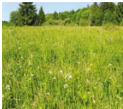
Druhově pestrá louka, která se nachází ve zvláště chráněném území Dolejší dráhy nedaleko Plánice na Klatovsku.

Péče o vzácná luční společenstva a oblasti s výskytem netopyrů, jež se nacházejí v devatenácti zvláště chráněných územích a osmi evropsky významných lokalitách Plzeňského kraje, by měla být v několika následujících letech financována převážně z prostředků Evropské unie. Odbor životního prostředí Krajského úřadu Plzeňského