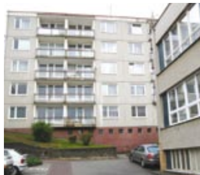
Domov pro seniory v domažlické Baldovské ulici 583, panelový dům postavený před třiceti lety, čeká kompletní rekonstrukce.

nací a rehabilitace. Ve zrekonstruované budově bude své služby poskytovat i Rodinná poradna Domažlice. Obnova celého objektu v Baldovské ulici 583 potrvá od letošního června do října roku 2011. Jako poslední budou provedeny terénní úpravy v okolí budovy, bude přistavěno parkoviště a chodníky. Plánovaná kapacita domova pro seniory je 130 klientů, kteří budou žít v nově vybavených 24 jednolůžkových pokojích, 29 dvoulůžkových pokojích a 24 obytných jednotkách 2+2, jež budou tvořeny dvěma samostatnými pokoji se společným sociálním zařízením.