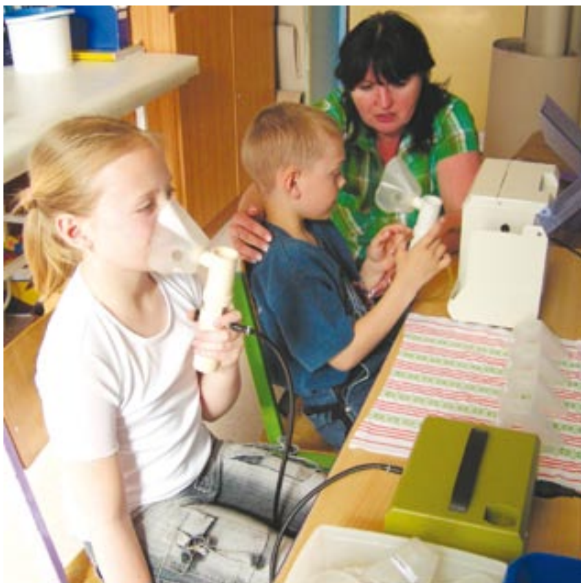
Žáci, kteří navštěvují respirační třídy, denně inhalují a hrají na flétnu, aby se naučili dýchat.