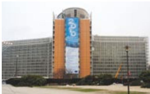
Budova Berlaymont, sídlo Evropské komise v Bruselu.

Kromě uvedených klíčových institucí má EU ještě řadu dalších. Jsou jimi například Evropský soudní dvůr, Evropský účetní dvůr, Evropský ombudsman, Evropská centrální banka, Evropská investiční banka, Evropský hospodářský a sociální výbor, Výbor regionů. Pod EU spadá také řada agentur, které slouží k naplnění různých konkrétních úkolů.