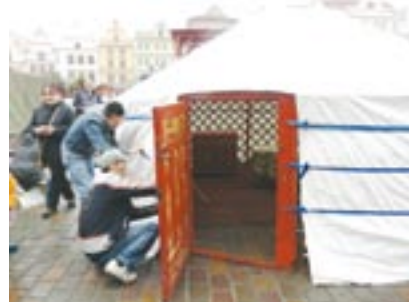
Centrum na podporu integrace cizinců v Plzeňském kraji pořádá také řadu multikulturních setkání. Snímek je z akce nazvané Netradiční tradice, která se odehrála před Vánoci na plzeňském náměstí Republiky. Navštěvníci viděli například pravou mongolskou jurtu.

„Integrovat se do cizí země není vůbec jednoduché. Děkujeme všem, kteří si to uvědomují a snaží se spolupracovat na náročném procesu, který vede ke společenské, politické a lidské spokojenosti,“ dodává Aneta Šlajerová.