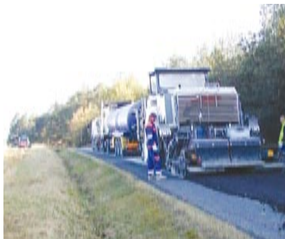
Mezi nejdůležitější akce loňského roku patřila rekonstrukce 7,7 kilometru dlouhého úseku silnice II/193 mezi městem Kladruby a hranicí okresů Tachov a Domažlice.

Mezi nejvýznamnější stavby dokončené v loňském roce patří tři přeložky silnic, a to III/1882 Chanovice-Oselce, II/190 Železná Ruda-Špičák a II/195 Poběžovice. Velmi důležitá byla také rekonstrukce silnice III/18322 ve Švihově a silnice II/193 v úseku Kladruby-hranice okresů Tachov a Domažlice. Mezi akce zásadního významu se řadí i oprava silnice III/18323 v úsecích