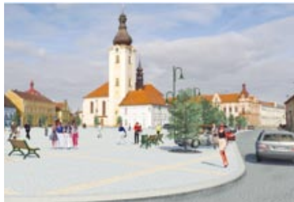
Rekonstrukce náměstí T. G. M. v Dobřanech se rychle chýlí ke svému závěru. Vizualizace ukazuje, jak bude plocha patřící do městské památkové zóny vypadat v letních měsících.

Hlavní dobřanské náměstí se během rekonstrukce změnilo po všech strán-