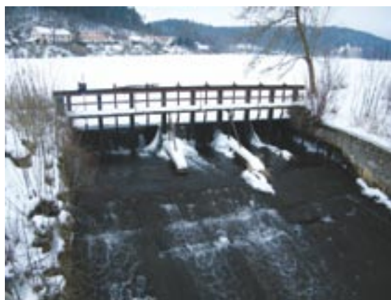
Žinkovský rybník, zvaný též Labuť, řadí odborníci z hlediska technickobezpečnostního dohledu do třetí kategorie vodních děl.

V další etapě se Plzeňský kraj zaměří na vytipování problematických vodních děl čtvrté kategorie. V případě zjištění nedostatků může být rozhodnuto o změně rozsahu technickobezpečnostního dohledu a podmínek pro jeho zajištění tak, aby rybníky a vodní nádrže byly nadále především příjemnou součástí životního prostředí a nikoliv potenciálním zdrojem ohrožení.