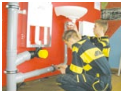
Krajské kolo soutěže Učeň instalatér 2010 bylo součástí Dne otevřených dveří Středního odborného učiliště stavebního v Plzni.

Neobvyklé téma Rybářská tabule měla soutěž budoucích kuchařů a číšníků, kterou organizovalo Střední