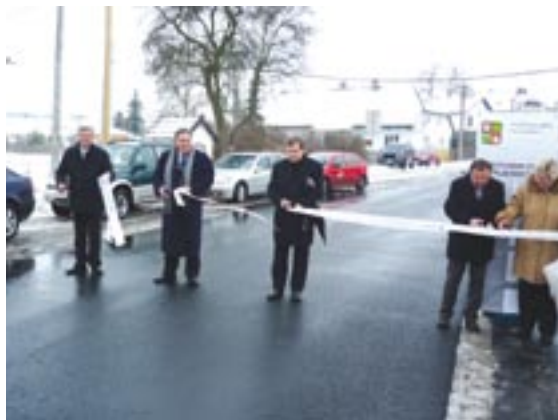
Při slavnostním uvedení zrekonstruovaného úseku silnice II/184 do provozu nechybělo stříhání pásky.