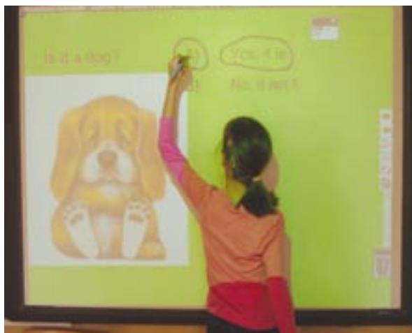
Výuka angličtiny ve třídě pro vysoce funkční autisty.

Rozsah aktivit však rozhodně neznamená, že by bylo zanedbáváno původní poslání školy, tedy speciálně pedagogická, psychologická a psychiatrická péče o hospitalizované děti. Vyučování, individuální nebo skupinové, probíhá na všech klinikách fakultní nemocnice. „Význam je jasný. Děti se tolik nesoustředí na svoji nemoc a ve škole nezažijí utrpení. Známkami, které u nás dostanou, se jim navíc započítávají do celkového hodnocení ve škole, kterou běžně navštěvují,“ konstatuje ředitelka školy Alice Kozáková.