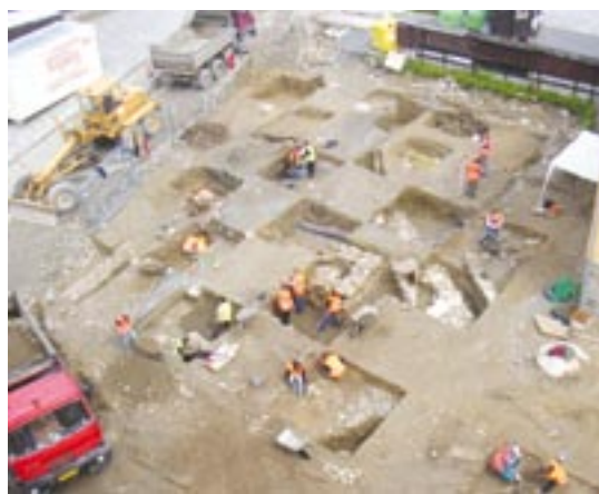
Záchranný archeologický výzkum předcházela také rekonstrukce náměstí v Kašperských Horách na Sušicku.

Náklady na realizaci záchranného archeologického výzkumu hradí právnické osoby vždy, fyzické osoby pouze v případě, že chystaná stavební činnost souvisí s jejich podnikáním. V ostatních případech platí náklady organizace, která archeologický výzkum provádí.