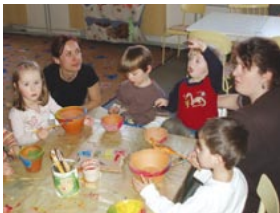
Na konci března uspořádalo staroplzenecké Rodinné centrum Dráček akci nazvanou Vydání zimy. Součástí programu bylo také zdobení květináčů na setbu obilí.

Rodinné centrum Dráček se může pochlubit i dalšími novinkami. Patří mezi ně bezplatný přístup k internetu či volně přístupná venkovní herna pro děti ve věku od jednoho roku do šesti let. Její vystavbu finančně podpořily staroplzenecká radnice a Diecézní charita Plzeň, která na realizaci projektu věnovala výtěžek z Tríkrálové sbírky. „Kromě kontinuálních aktivit připravujeme také jednorázové akce pro veřejnost. Jsou to například bazárky oblečení, maškarní kamevaly či pohádková dopoledne, která vznikla na základě projektu Celé Česko čte dětem, jehož jsme partne-