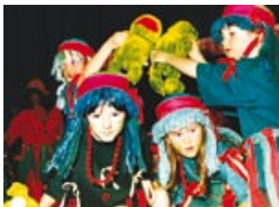
Festivalu Mateřinka se v minulosti několikrát zúčastnily také děti z 91. mateřské školy v Plzni. Snímek vznikl při vystoupení s názvem Vodnický bál.

Děti se díky mateřským školám mohou zapojit do řady kulturních soutěží a přehlídek, kde uplatní získané dovednosti i talent. Velkou tradici má například festival Mateřinka, celostátní nesoutěžní přehlídka mateřských škol. V Plzeňském kraji se letos uskutečnilo jedno oblastní kolo, a to v polovině března v okrese Plzeň-sever. Na akci Kralovická Mateřinka vystoupily děti z dvanácti mateřských škol. Na květnové celostátní přehlídce v Nymburce se na základě rozhodnutí Nadačního fondu Mateřinka představí mateřské školy z Kralovic a Třebošné.