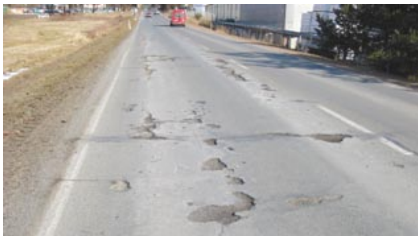
Na některých silnicích druhé a třetí třídy se letošní zima podepsala opravdu výrazně. Jsou úseky, kde se výtlučkům téměř nejde vyhnout.

Letošní zima dala silničářům opravdu zabrat. Už v jejím průběhu tušili, že se velké množství sněhu v kombinaci s mrazem výrazně podepíše na kvalitě asfaltových koberců. „Řada silnic druhé a třetí třídy měla už před zimou takzvané mozaikové trhliny. Ty vznikají především v místech, kde je vozovka silně namáhaná automobilovým provozem. Těmito trhlinami pak mezi jednotlivé vrstvy vozovky proniká při dešti či tání sněhu voda. Ta při poklesu venkovní teploty pod bod mrazu v trhlinách zmrzne, její objem se zvětší a to má destruktivní následky. Trhliny se neustále zvětšují, jejich hrany se olamují a tak vznikají všemi řídicí nenáviděné výtlučky,“ popisuje nejčastější formu poškození silnic v zimním období Josef Felber, technický náměstek Krajské správy a údržby silnic Plzeňského kraje.