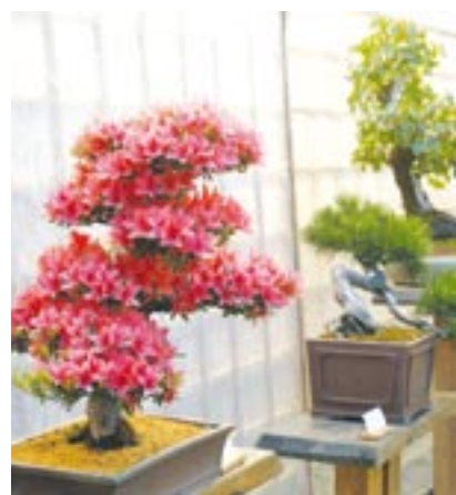
Zámek v Merklíně u Přeštic bude v polovině května patřit nádherným bonsajům.

Popularita výstavy rok od roku roste, loni ji navštívily téměř dva tisíce lidí. „Věříme, že i letos Bonsai Merklín splní svůj hlavní cíl a stane se oázou harmonie a klidu v dnešní uspěchané době, místem, kde se lidé na chvíli zastaví a zamyslí,“ uzavírá Zdeňka Nosková.