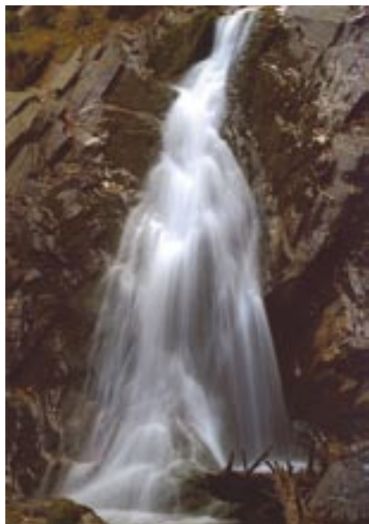
Vítězný snímek Václava Hrušky nazvaný Vodopád .