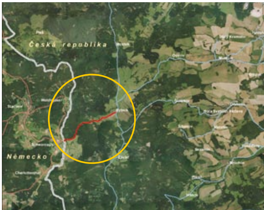
Aby mohl být hraniční přechod Rybník-Schwarzach v budoucnu otevřen také pro osobní automobily, je třeba postavit novou silnici. Na mapě je její plánovaná trasa vyznačena červeně.

Hodně se diskutovalo o možnostech vzniku nových hraničních přechodů určených pro automobily. „Vzhledem k tomu, že jsme oddělení hornatým územím Šumavy a Českého lesa, jsou možnosti budování nových hraničních přechodů velmi omezené. V úvahu navíc připadají pouze přechody určené pro osobní vozidla, nikoliv pro nákladní automobily,“ říká Jaroslav Vejprava, vedoucí Odboru dopravy a silničního hospodářství Krajského úřadu Plzeňského kraje. Nový hraniční přechod určený pro osobní vozidla by