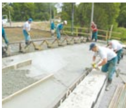
Součástí nového úseku silnice II/196 v Poběžovicích na Domažlicku je také most přes potok zvaný Pivoňka. Takto vypadala stavba v červnu loňského roku.

Přípravné práce včetně důkladného archeologického průzkumu lokality byly zahájeny v srpnu 2008, samot-