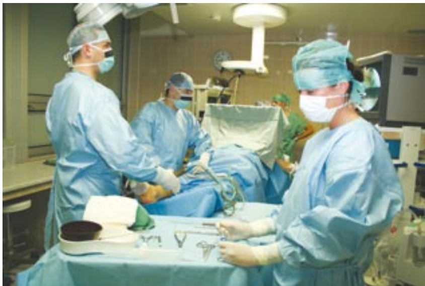
Artroskopická operace na Klinice ortopedie a traumatologie pohybového ústrojí Fakultní nemocnice Plzeň.

Projekt už dostal konkrétní obrysy. „V první řadě chceme propojit česká a německá pracoviště tak, aby bylo možné například operativně přenášet rentgenové snímky, vzájemně konzultovat jednotlivé případy za pomoci simultánního překladu či domluvat transporty pacientů. Součástí technických úprav by bylo i zřízení servisního telefonu pro pacienty, aby měli možnost prodiskutovat navrhovaný