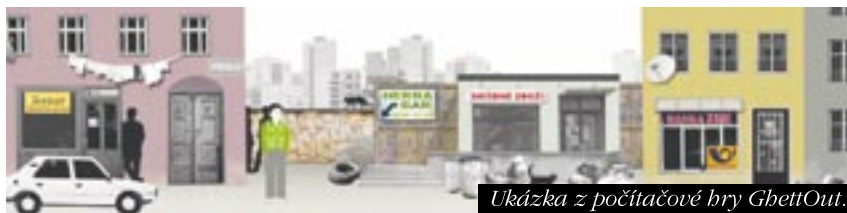
Ukázka z počítačové hry GhettOut.

Více informací o projektu, který se již objevuje i v rámci výuky na některých základních školách, se dozvíte na www.ghettout.cz .