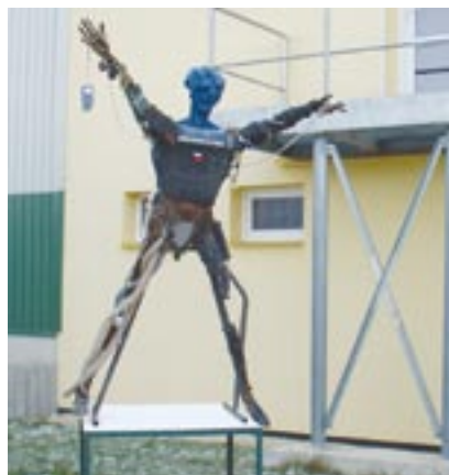
Vchod do Výukového centra odpadového hospodářství v Černošíně na Tachovsku hlídá od konce loňského roku Šrotonátor.

Pokud se potřebujete zbavit vysloužilého elektrořádku, můžete využít hustou síť míst zpětného odběru. V Plzeňském kraji to jsou hlavně sběrné dvory odpadů. Aby byla elektrická a elektronická zařízení odebrána bezplatně, nesmí být rozebrána. To znamená, že například pračky musejí mít motor a lednice kompresor. Seznam sběrných dvorů i s provozní dobou je v elektronické podobě umístěn na adrese www.plzensky-kraj.cz v sekci Životní prostředí, odpady.