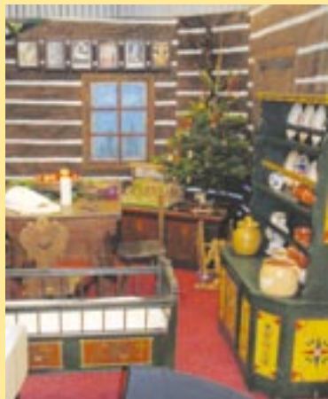
Součástí výstavy Tradice českých Vánoc byla také venkovská světnice z přelomu 19. a 20. století.

Součástí bruselské expozice byly například charakteristicky ozdobené vánoční stromky, betlémy různého provedení či ukázky vánočních zvyků na dobových vyobrazeních. Představeno bylo také tradiční české vánoční pečivo. V den slavnostního zahájení výstavy byla k vidění i výroba lidových ozdob. „Všichni věříme, že výstava v sídle Evropské unie výrazně přispěla k propagaci Plzeňského kraje a celé České republiky,“ dodává radní Plzeňského kraje pro oblasti kultury, památkové péče, cestovního ruchu a marketingu Václav Koubík, který 16. prosince výstavu slavnostně zahájil.