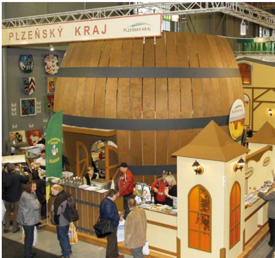
Prezentaci Plzeňského kraje na veletrhu Regiontour v Brně dominoval obrovský pivovarnický sud.

Na možnosti cykloturistiky byl soustředěn další březnový veletrh, tentokrát v Hradci