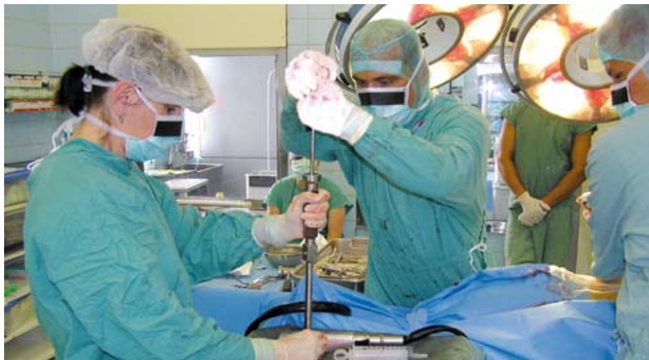
Snímek z operačního sálu nemocnice v Klatovech, na kterém je zachycena příprava na zavedení pánevní části endoprotézy kyčelního kloubu.

a přispějí k rozšíření velice prospěšné mezinárodní spolupráce. ■