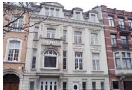
Dům, který Plzeňský kraj kupuje v Bruselu pro své zastoupení při Evropské unii.