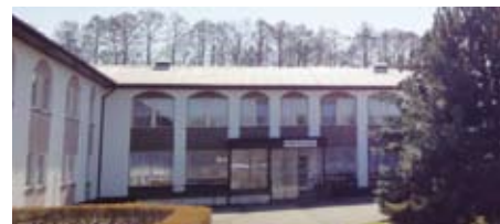
Budova vlčického domova se nachází zhruba dva kilometry od Blovic na jižním Plzeňsku.

například pravidelných cvičení k posílení fyzické kondice, četby na pokračování, takzvaných kaváren spojených s kulturním programem, někteří studují univerzitu třetího věku. Kdo má zájem, může se zapojit třeba do společného vaření a pečení či do kroužku, kde se vyrábějí krásné dekorační předměty,“ uzavírá Hana Jenčíková. Více informací o vlčickém domově najdete na adrese www.domov-vlcice.cz . ■