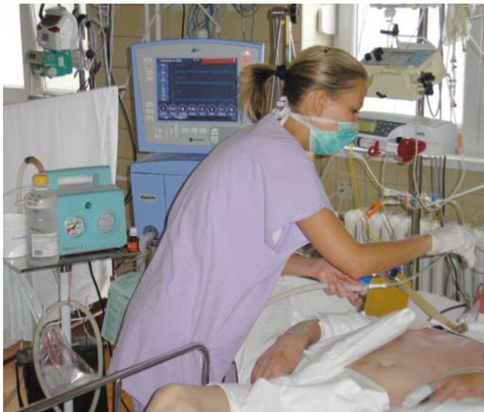
Plzeňský kraj se snaží ve svých nemocnicích v maximální možné míře podporovat celoživotní vzdělávání zdravotnického personálu. To se samozřejmě týká i sester. Ilustrační foto

Plzeňského kraje a úspěšné absolvování příjímacího řízení. Po zdárném ukončení kurzu získá student osvědčení nebo může při splnění studijního průměru do 1,5 pokračovat v bakalářském studiu,“ vysvětluje Jan Karásek, který je pověřený řízením Odboru zdravotnictví Krajského úřadu Plzeňského kraje. K zajištění dostatku kvalifikovaných pracovníků v krajských nemocnicích přispívá také dotační program ministerstva zdravotnictví. Jedná se o takzvaná rezidenční místa, která umožňují lékařským i nelékařským zaměstnancům nemocnic po dokončení studia absolvovat specializační vzdělávání, tedy například atestační přípravu. O rezidenční místa mohou požádat všechna zdravotnická zařízení, která mají akreditaci pro vzdělávání. V případě akceptování žádosti získají finanční dotaci od ministerstva zdravotnictví, která pokrývá náklady na vzdělávání absolventa a platy rezidenta i školitele. V loňském roce se mezi úspěšně žadatele o rezidenční místa zařadily například nemocnice v Domažlicích a Klatovech. ■