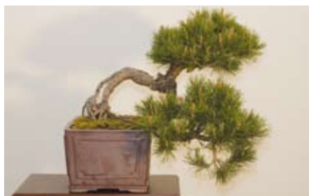
Merklínský zámek bude na konci května patřit nádherným bonsajím.

Popularita výstavy rok od roku roste, loni ji navštívily více než dva tisíce lidí. „Věříme, že i letos Bonsai Merklín splní svůj hlavní cíl a stane se oázou harmonie a klidu v dnešní uspěchané době, místem, kde se lidé na chvíli zastaví a zamyslí,“ uzavírá Zdeňka Nosková. Více informací o akci naleznete na internetové adrese www.bonsaimerklin.cz .