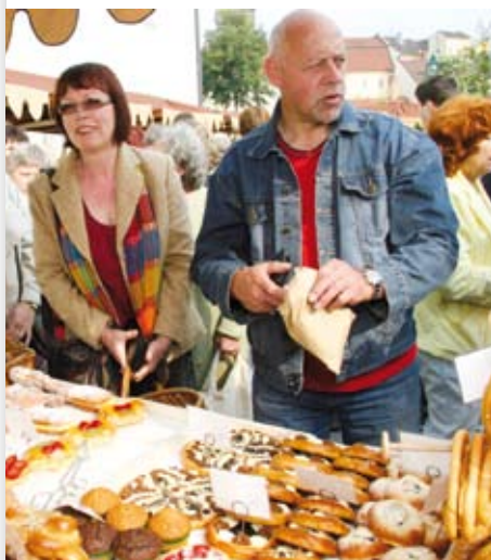
Na nádvoří krajského úřadu se uskuteční v pátek 17. a v sobotu 18. června první Festival regionálních potravin.