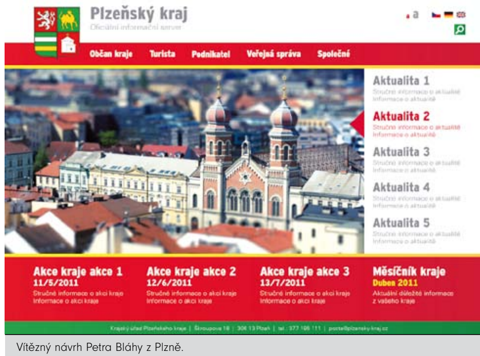
Vítězný návrh Petra Bláhy z Plzně.

portálu Plzeňského kraje. Nově koncipované internetové stránky na stávající adrese www.plzensky-kraj.cz by měly být uvedeny do provozu nejpozději 1. ledna příštího roku.