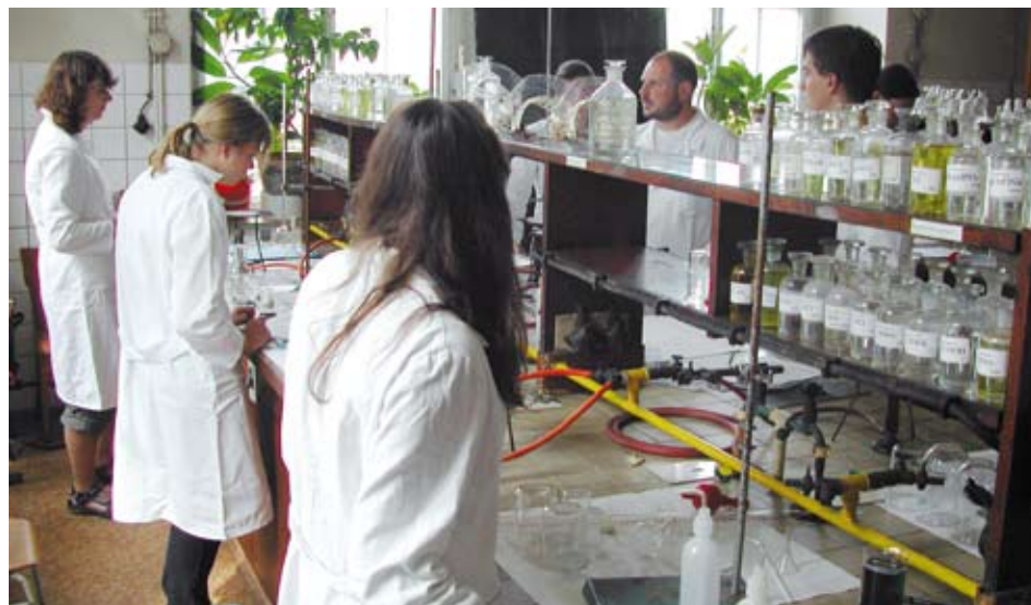
Na letošních úspěšných žáků z našeho regionu v rámci vědomostních soutěží mají velký podíl i kempy pro talenty. Loni o prázdninách se uskutečnily poprvé. Snímek pochází z laboratoří, kde se žáci věnovali přírodovědným oborům.

Mnozí žáci, kteří letos bodovali v celostátních kolech vědomostních soutěží, se zúčastnili loňských odborných kempů pro nadané žáky v rámci projektu, který realizuje Středisko služeb školám Plzeň a jenž byl finančně podpořen z evropských fondů a státního rozpočtu. Úspěšné kempy pro talenty se uskuteční i letos, a to v týdnu od 22. srpna. Nárok na bezplatnou účast mají první tři soutěžící z krajských kol jedenácti předmětových olympiád, patnáct vybraných vítězů soutěží základních uměleckých škol a učitelé vítězných žáků. Více informací najdete na www.podporatalentu.cz .