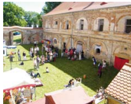
Mezi úspěšné žadatele se v prvním kole krajského dotačního programu na podporu spolkové činnosti zařadil také Český svaz ochránců památek v Plzni. Díky finanční podpoře bude moci i letos uspořádat Historický víkend na zámku v Čechovicích u Holýšova. Výtěžek z akce již tradičně poputuje na obnovu této historické památky.