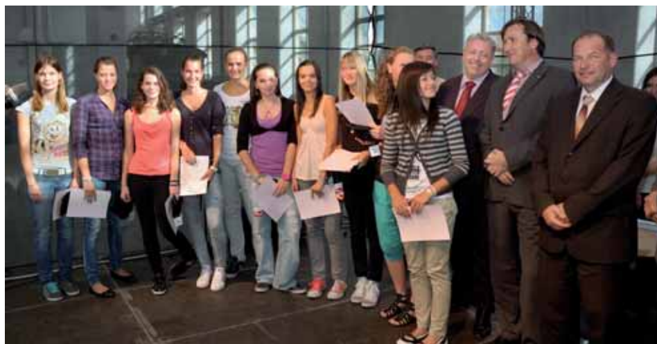
Družstvo stříbrných volejbalistek z Plzeňského kraje