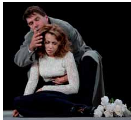
Inscenace Strýčka Váni v podání Divadla Jevgenije Vachtangova

Již 19. ročník Mezinárodního festivalu DIVADLO tradičně finančně podpořil Plzeňský kraj. Pro letošní rok byla pořadatelům poskytnuta dotace ve výši 700 tis. Kč. Více informací na www.festivaldivadlo.cz