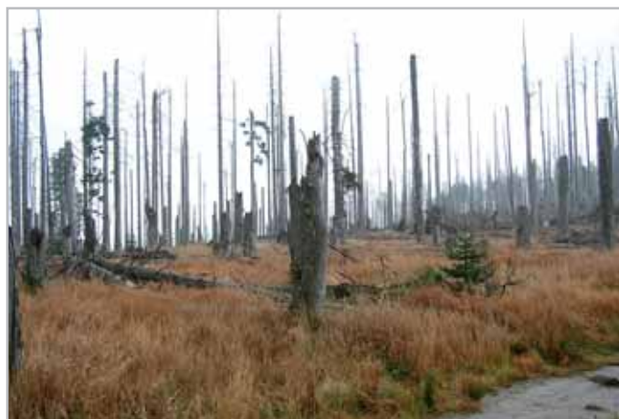
Rozhovor se starostkou Kašperských Hor Alenou Balounovou na téma nového zákona o Národním parku Šumava (str. 5)