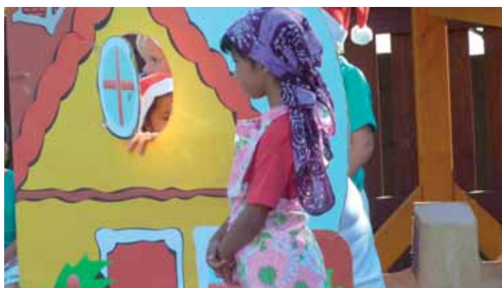
Děti předvedly hostům divadelní představení

V letošním roce oslavil Dětský domov Trnová již šedesátileté výročí svého založení. A můžeme říct, že se oslavy, které dětský domov uspořádal, opravdu povedly a všechny děti se jistě už těší na další Vánoce zase za rok.