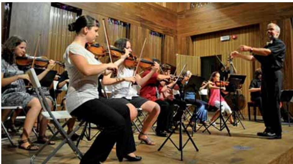
Koncert žáků základních uměleckých škol

Bližší informace na webových stránkách dětského domova: www.ddkasperky.cz .