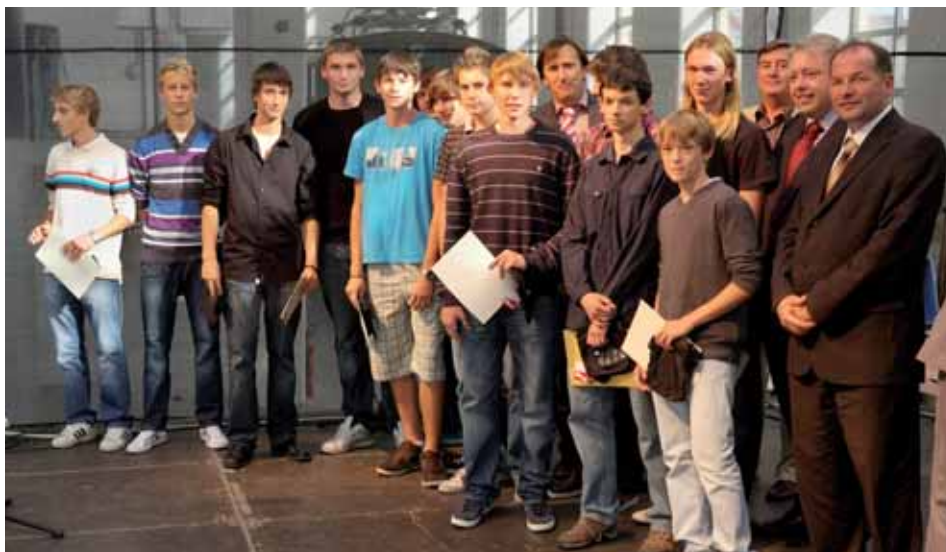
Vítězní házenkáři z Plzeňského kraje

Plzeňský kraj bude i nadále olympijské hry dětí a mládeže podporovat. V současné době již probíhají přípravy na V. zimní olympiádu dětí a mládeže, která se bude konat 29. 1. – 3. 2. 2012 v Moravskoslezském kraji.