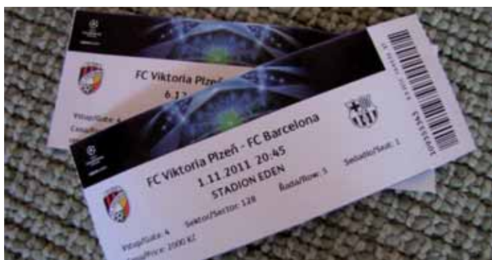
Vstupenky na utkání FC Viktoria Plzeň vs. FC Barcelona

otázku. V případě shody ve správných odpovědích u více soutěžících vyhrávají ti soutěžící, kteří své odpovědi doručili jako 25., 55. a 100. v pořadí ze správných. Své odpovědi zasílejte elektronicky na adresu redakce@plzensky-kraj.cz a to nejpozději do 28. září 2011. Podrobná pravidla soutěže naleznete na internetových stránkách Plzeňského kraje www.plzensky-kraj.cz .