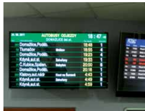
Informační panely pro cestující na Plzeňsku

Informace ze zobrazovacích panelů budou dostupné také na internetových stránkách. Projekt na instalaci informačních panelů může být realizován díky finanční podpoře z Evropské unie.