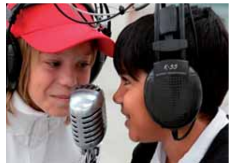
Dětské pěvecké vystoupení na setkání v Techmanii