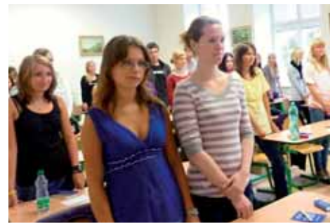
Studenti zahájili nový školní rok

Všichni zúčastnění přejí všem školákům i jejich učitelům šťastné vykročení do školního roku 2011/2012. Ať přinesou další úspěchy a posune školství našeho kraje zase o stupeň výš.