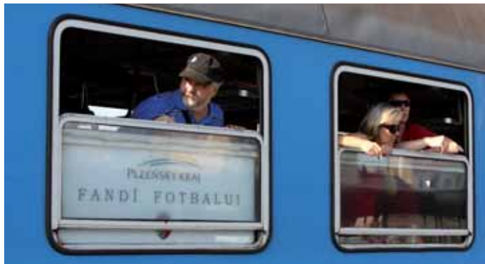
Speciální vlak vypravený Plzeňským krajem