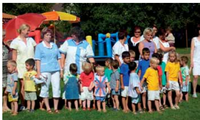
Děti z domova v Trnové se svými vychovatelkami