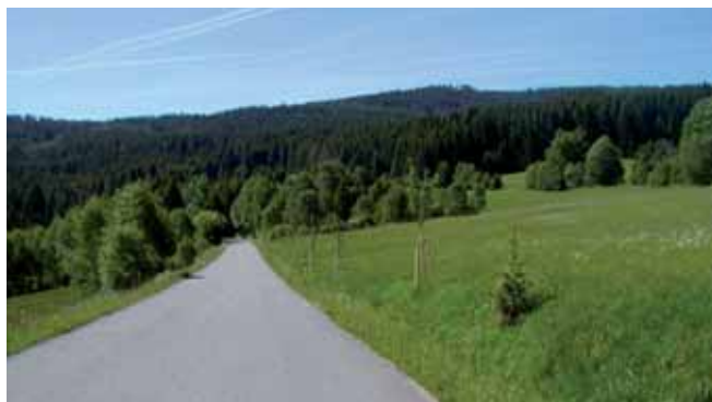
Silnice III. třídy zařazená do projektu Regenerace zeleně

Více informací najdete na adrese: www.stromy-podkontrolou.cz .