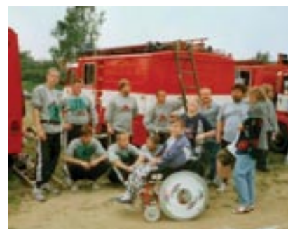
Členové Sboru dobrovolných hasičů Halže na Tachovsku.

Nový hasičský vůz si budou moci všichni obyvatelé Halže s největší pravděpodobností prohlédnout už v sobotu 27. června. Na tento den jsou naplánovány oslavy, které připomínají výročí první písemné zmínky o obci. Od té uplynulo již 530 let.