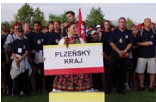
Funkci vlajkonoše výpravy Plzeňského kraje si v minulosti vyzkoušel také brankář české fotbalové reprezentace Petr Čech.