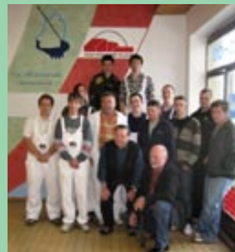
Společná fotografie učňů SOU stavebního v Plzni a jejich přátel z Berufsschule Grafenwöhr v Dolním Bavorsku.

V letošním roce Plzeňský kraj zatím poskytl jedenácti školám celkem 370 tisíc korun. Peníze z krajského rozpočtu pomohou například Gymnáziu Sušice rozvíjet spolupráci se švýcarskou partnerskou školou Sekundarschule Uetendorf. Studenti domácího Gymnázia J. Š. Baara budou za podpory Plzeňského kraje pracovat se svými kamarády z Gymnázia Wernera von Siemens v Regensburgu na projektu, jenž se zabývá historií obou stran česko-bavorské hranice. Za zmínku určitě stojí také velmi úspěšné počínání učňů Středního odborného učiliště stavebního v Plzni a skupiny německých učňů oboru malíř z Berufsschule Grafenwöhr v Dolním Bavorsku, kteří letos v dubnu s použitím různých malířských technik a materiálů společně zahájili rozsáhlé úpravy vstupních prostor plzeňské školy.