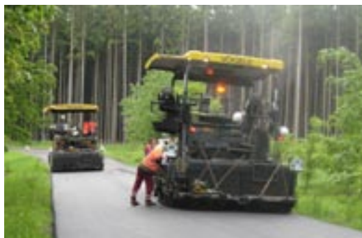
Krásná silnice, v jejím okolí krásná příroda. Co víc si může řídit přát?

„Pokud je to technicky možné, většinu prací se snažíme dokončit v první polovině roku. Chceme, aby si lidé mohli jízdu po opravených silnicích užívat co nejdříve,“ dodává Jaromíra Škublová.