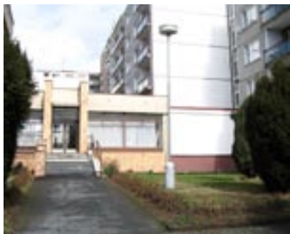
Domov pro seniory v domažlické Baldovské ulici čeká na rekonstrukci.

Centrum sociálních služeb Domažlice je přejmenovaný Ústav sociálních služeb Domažlice, veřejnosti známý jako domov důchodců a penzion. Sociální služby poskytuje ve třech zařízeních. Dvě jsou pobytová a jedno ambulantní. Mezi pobytová patří Domov pro seniory Domažlice a Domov pro seniory Černovice, ambulantním zařízením je Rodinná poradna Domažlice.