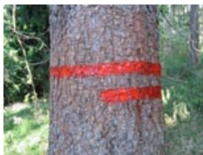
Tento strom není určen k pokácení. Červené pruhy na jeho kůře jen označují hranici maloplošného chráněného území.

A jak zvláště chráněná území poznáte? Všechna jsou v terénu u přístupových cest označena tabulemi se státním znakem a příslušnou kategorií. Hranice těch maloplošných jsou navíc po obvodu označena červenými pruhy, které najdete především na kůře stromů. Dva pruhy jsou vidět zvenku zvláště chráněného území, jeden zevnitř. Některé lokality jsou navíc osazeny informačními tabulemi.