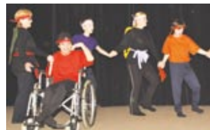
Klienti milířského domova si připravili celkem šest vystoupení. Snímek je z představení „My jsme přátelé“.

Součástí přehlídky byl křest publikace, která popisuje vznik a vývoj projektu Prostor pro duši.