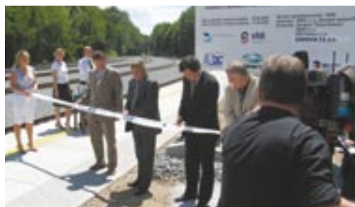
Slavnostní otevření zrekonstruované železniční stanice v České Kubici na Domažlicku.