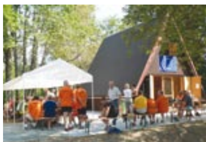
Součástí cyklotrasy vedoucí z Tachova do Silberhütte je chata na Zlatém potoce.

Významných investic se zároveň dočká také sportovní areál v bavorském Silberhütte. Evropské peníze pomohou s vybudováním nové požární nádrže a s vytvořením systému umělého zasněžování běžeckých lyžařských tratí, které zasahují i do Čech. „Předpokládáme, že by se tím mohla zimní sezona prodloužit na tři až čtyři měsíce,“ říká Vladislav Krumer.