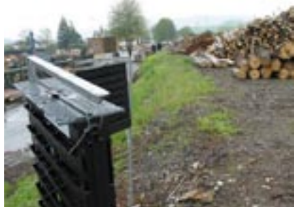
Takto vypadá lapač na kůrovce, který je instalován na manipulačním skladu dřeva.

Dlouhodobé rozšiřování Lýkožrouta smrkového neboli kůrovce na Sušicku přimělo místní lesní hospodáře k mimořádným opatřením, která vedou k ochraně obecních i soukromých porostů. Současné šíření kůrovce je nekontrolovatelné. Je způsobené také přeletem z Národního parku Šumava i vyletováním z napadeného dříví při transportu a na dřevoskladech. Jsme