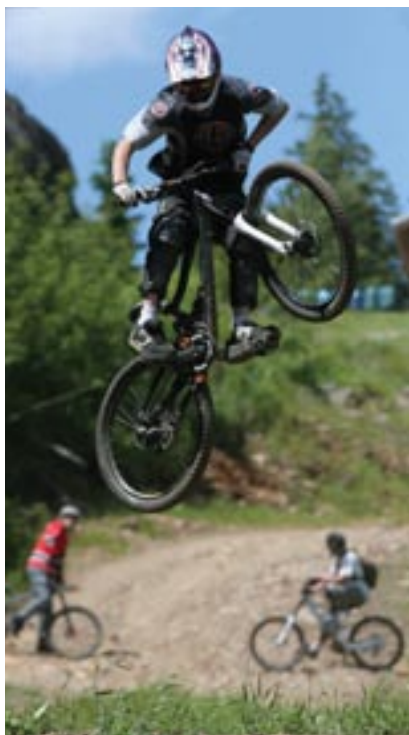
K oblíbeným atrakcím letní sezony na Železnorudsku patří Bike park.

O prázdninách se na Železnorudsku uskuteční řada kulturních a sportovních akcí. Jedná se například o Rysí slavnosti, Železnorudské slavnosti, koncerty v kostele v Hojsově Stráži či závody v již zmíněném Bike parku.