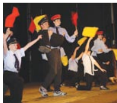
Příprava muzikálového představení trvala kralovickým školákům zhruba tři měsíce.

akce. Uděláme pro to maximum,“ uzavírá Libor Formánek.