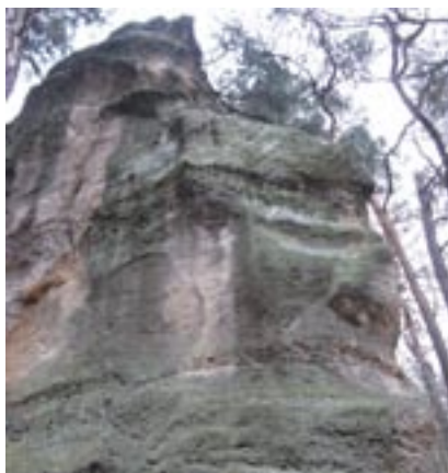
Mezi maloplošná zvláště chráněná území patří také Malesická skála.

V Plzeňském kraji je v současnosti 181 maloplošných zvláště chráněných území o celkové rozloze zhruba 11 tisíc hektarů. V dohledné době přibudou další. „Připravujeme například vyhlášení přírodní rezervace Rašeliniště u Políněk v okrese Plzeň-sever,“ říká Lenka Pivoňková.