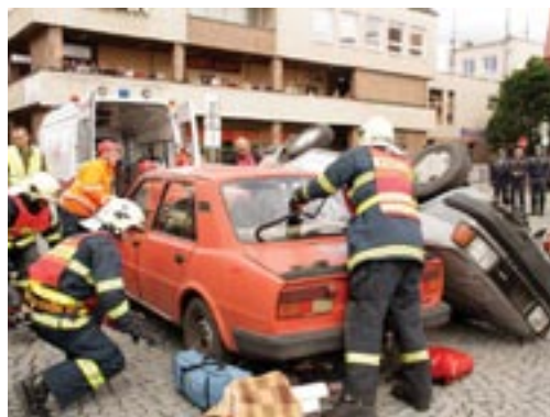
Záchrannářské týmy si musely poradit s několika scénáři vážné dopravní nehody.

potíží byl napsán na papírku umístěném na těle. Organizátoři si letos dali velkou práci s namaskováním „zraněných“ osob. Popáleniny, zlomeniny, tržné rány, otoky a další šrámy se daly od těch skutečných jen těžko rozeznat.