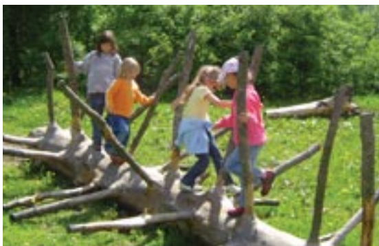
Na Westernovém ranči Podolí i v jeho okolí si děti užily spoustu legrace.

nosti. Společně se svými pěstouny také navštívily Pohádkovou chalupu v nedalekých Mlázovech, kde je umístěna netradiční výstava šumavských pohádkových bytostí,“ popisuje Eva Nosková. Na ranč přijeli za dětmi a jejich pěstou-