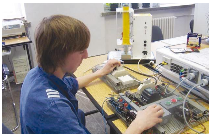
Technické obory a řemesla se v současnosti potýkají s výrazným úbytkem mladé krve. Děti mají zájem především o studium na gymnáziích.

Projekt pod taktovkou krajské hospodářské komory je spolufinancován z Evropského sociálního fondu prostřednictvím Operačního programu Vzdělávání pro konkurenceschopnost a státním rozpočtem České republiky.