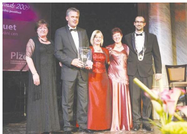
Chrudimská delegace převzala jedno z ocenění od předsedkyně poroty Claudette Savaria z Kanady (na snímku vlevo).

Mezi letošními finalisty byli představitelé měst z celé planety, od těch nejmenších (Carlyle, Kanada, 1257 obyvatel) až po ty největší (Rijád, Saúdská Arábie, 4,2 milionu obyvatel).