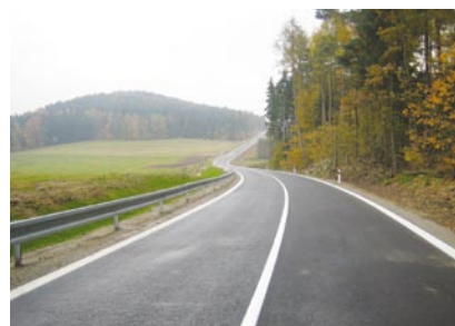
Poslední chvíle klidu. Tak vypadala nově vybudovaná silnice spojující obce Oselce a Chanovice krátce před slavnostním otevřením. Vzápětí na ni vyjely první automobily.