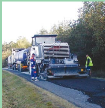
Rekonstrukce 7,7 kilometru dlouhého úseku silnice II/193 trvala zhruba měsíc.

„Součástí stavebních prací byla také povrchová úprava všech křižovatek a sjezdů, nezapomněli jsme na zpevnění krajnic. Tam, kde to bylo nutné, byly prohloubeny a vyčištěny silniční příkopy. Samozřejmě je také nové svíslé a vodorovné dopravní značení,“ dodává Miroslav Sedláček.