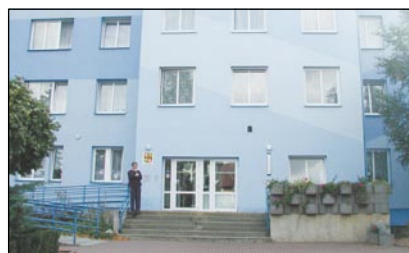
Dosavadní hlavní budova DOZP bude i nadále sloužit jako centrum služeb pro zdravotně postižené klienty.