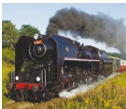
Šlechtična, parní lokomotiva vyrobená v roce 1947, byla hlavní atrakcí oslav Dne železnice.

do prostoru tzv. hlavní služby, což je veřejnosti nepřístupné místo, odkud se řídí chod celého nádraží. Velký zájem byl také o svezení na historické drezíně. V čekárně bylo k vidění modelové kolejiště s elektrickými vláčky a výstava dobových obrázků, které se vztahují k domažlickým tratím. „Dobrou náladu podporovaly příjemné country písně hudební skupiny Vysoká tráva, která hrála jak na domažlickém nástupišti, tak i ve vlaku při jízdách do Kdyně a Klenčí pod Čerchovem," dodává Vladimír Kostelný.