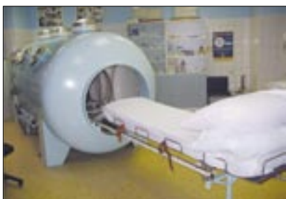
Příprava lůžka pro ležícího nemocného před expozicí.

Jeden pobyt v barokomore, zvaný expozice, je rozdělen do tří fází – komprese, izokomprese a dekomprese. První a třetí trvají pouze několik minut, zatímco vlastní léčebná fáze, tedy ta prostřední, 90 až 120 minut. Pacient je při izokompresi v přetlaku vzduchu a dýchá zvláštní ústenkou stoprocentní medicínální kyslík. Do barokomory se vejdu dva lidé, jeden může ležet, druhý sedí. Pro pacienty, kteří nejsou ohroženi na životě, to není náročný typ léčby, mohou při ní poslouchat hudbu nebo si číst. Počet expozic je závislý na indikaci, vývoji onemocnění a zvláště pak na úspěšnosti předchozí léčby.