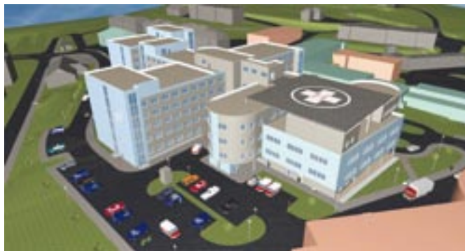
Takto bude vypadat nový monoblok klatovské nemocnice.

Plně zbarťerový objekt bude mít na střeše heliport, na němž budou moci přistávat i stroje těžší než 6,5 tuny. U monobloku bude 65 venkovních parkovacích stání. Dalších 200 míst vznikne v parkovacím domě, který zároveň odcloní hluk z nedaleké silnice.