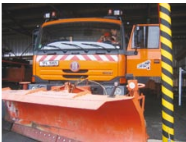
Do konce října by měla být hotová kontrola technického stavu všech sypacích vozů v Plzeňském kraji.

Veškeré práce se budou řídit podle jednotlivých Plánů zimní údržby silnic na období 2009/2010. Tento dokument má totiž zpracovaný a schválený každá Správa a údržba silnic, kterých je v Plzeňském kraji celkem šest. „Jsem přesvědčený, že se