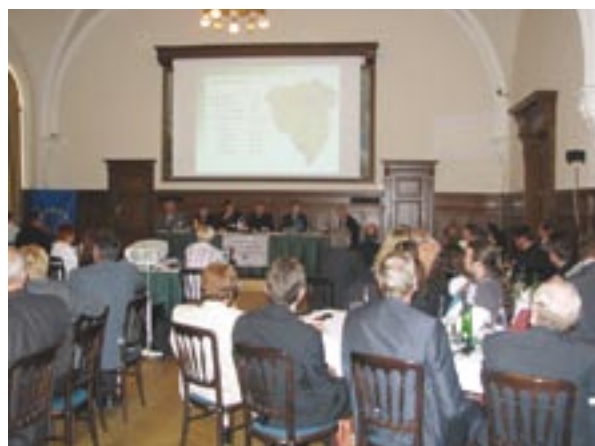
Přednáškové bloky symposia hostil Velký sál Plzeňského Praždroje.

Symposium bylo spolufinancováno Evropskou unií z Evropského fondu pro regionální rozvoj - Investice do Vaší budoucnosti, Operační program Cíl 3 ČR – Bavorsko.