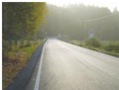
Krásná příroda a zbrusu nová silnice. To je pobled, který musí nadchnout každého řidiče.

Silnice získala nový povrch v úsecích Staňkov-Krchleby a Krchleby-Zelený Háj. Celková délka opravené vozovky je více než 3,4 kilometru. „Zhruba 300