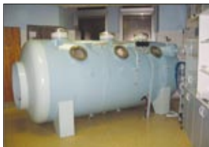
Léčebná barokomora středního typu.

Z médií se dozvídáme o zcela zbytečných úmrtích. Lidé přicházejí o život proto, že nebyli včas převezeni na účinnou léčbu. Místem častých tragédií je například koupelna, kde je využíván plynový průtokový ohřívač vody neboli karma. Při jeho provozu může dojít v malé a uzavřené místnosti k vyčerpání kyslíku, následuje špatné spalování jinak netoxického zemního plynu a produkce jedovatého oxidu uhelnatého. Člověk v tomto prostředí ztratí vědomí, může se utopit