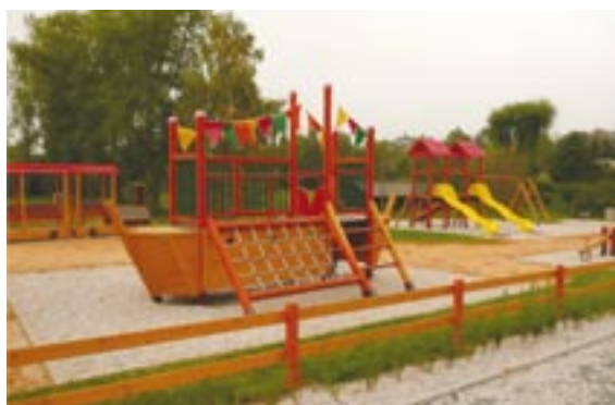
Program stabilizace a obnovy venkova pomohl i se vznikem dětského hřiště v Dolní Bělé na severním Plzeňsku.

Program stabilizace a obnovy venkova bude pokračovat i v příštím roce. Už dnes je však jasné, že částka, kterou budou mít města a obce k dispozici, rozhodně nedosáhne letošních 65 milionů korun. Podle předběžných odhadů se bude pohybovat kolem 52 milionů.