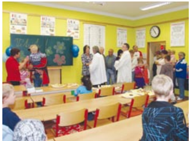
Účastníci Dne otevřených dveří v běšinské základní škole si mohli prohlédnout také zrekonstruované třídy.

Druhá etapa rekonstrukce běšinské základní školy je naplánovaná na příští rok. Na řadě bude přízemí objektu. Náklady na opravu by se měly pohybovat kolem dvou milionů korun.