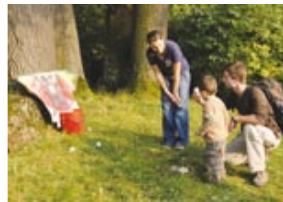
Pro malé účastníky Evropské noci pro netopýry v Žihobcích byla připravena řada soutěží.

Pro děti i rodiče bylo přichystáno občerstvení v předsádku kina, kde si zároveň všichni mohli prohlédnout výstavu fotografií netopýrů i obrázky a výrobky dětí za základní školy. Po skončení soutěží se všichni přesunuli do sálu a vyslechli povídání Ludka Bufky o životě netopýrů, které bylo doprovázeno promítáním. Když se venku setmělo, všichni mohli pozorovat netopýry poletujících v parku, vyslechnout jejich zvuky zesílené echolokátorem a vystoupit na zámeckou půdu, kde přebývá letní kolonie vrápenců malých.