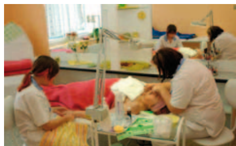
Žákyně oboru kosmetička provádí svou odbornou praxi v kosmetickém salónu

Absolventi tříletých oborů vzdělání si mohou doplnit vzdělání ve dvou oborech nástavbového studia zakončeného maturitní zkouškou – dřevařská a nábytkářská výroba a podnikání. Denní forma nástavbového studia podnikání trvá dva roky, dálková tři roky.