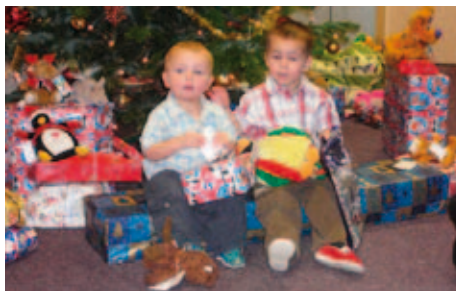
Vánoce v Dětském domově Trnová

matek, děti s fetálním alkoholovým syndromem, děti matek závislých na návykových látkách...), přijímány jsou děti s kombinovaným postižením (tělesné, mentální, smyslové...), děti zanedbávané, zneužívané a týrané. Všem těmto dětem je poskytována dlouhodobá komplexní zdravotní péče včetně potřebné diagnostiky před umístěním dětí do náhradní rodinné péče, která není v rezortu zdravotnictví řešena jiným způsobem. Převodem do rezortu MPSV by došlo k omezení zdravotní péče o ohrožené děti a zároveň i k nesystemovému kroku, kdy by zdravotní péče musela být poskytována jiným než zdravotnickým rezortem. Není pravdou, že jsou děti do těchto zařízení umístovány především z důvodů sociálních, jak argumentují předkladatelé pozměňovacího návrhu.