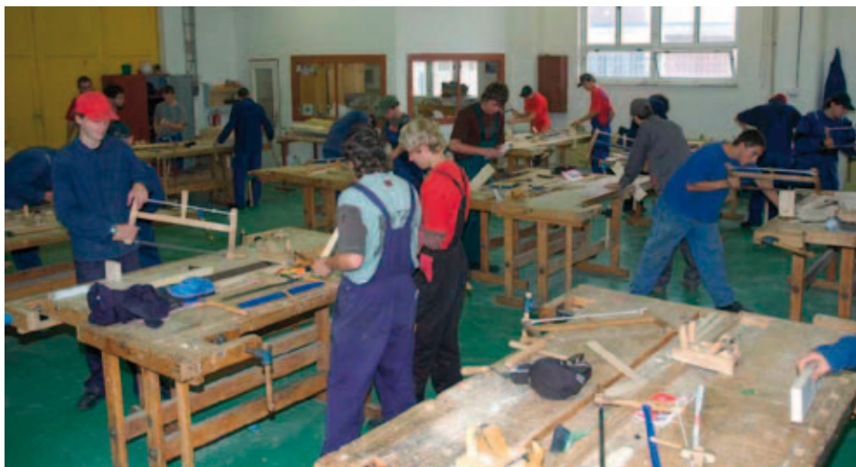
Žáci oboru truhlář absolvují svou odbornou praxi

hospodářských komor Od vzdělání k zaměstnání v Domažlicích, Kam na školu, kam do učení, kam za vzděláním v Klatovech, Akademie řemesel v Tachově, Veletrh perspektivy řemesel ve Stodu. Při náboru žáků ZŠ je dobrá spolupráce s řediteli ZŠ i s jejich výchovnými poradci. V maximální míře se snažíme o osobní kontakt s žáky ZŠ i s jejich rodiči formou exkurzí na naší škole a osobních návštěv na základních školách. Pro žáky ZŠ i v letošním školním roce připravujeme