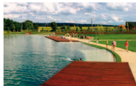
Přírodní koupací biotop v Dobřanech