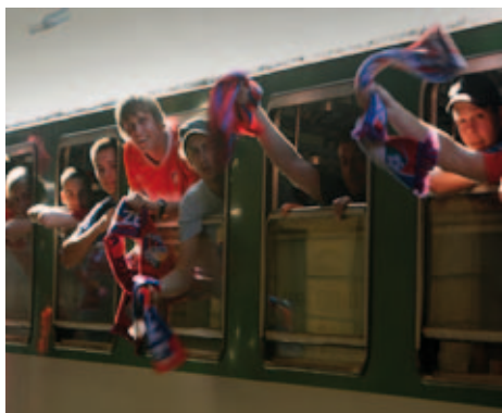
Na kvalifikační utkání Ligy mistrů s FC Kodaň vypravil Plzeňský kraj pro plzeňské fanoušky do Prahy speciální vlak.