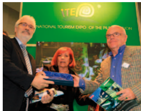
Soutěž propagačních materiálů

Celkem bylo zaevidováno 105 propagačních materiálů z toho 26 image materiálů, 24 tematicky zaměřených letáků, 32 brožur, průvodců a 23 map. O výsledku soutěže rozhodovala odborná porota složená ze zástupců Plzeňského kraje a odborné veřejnosti. Oceněny byly vždy tři nejlepší materiály z každé kategorie, které byly k vidění přímo na veletrhu ITEP 2011. Podrobný seznam vítězů naleznete na www.turisturaj.cz