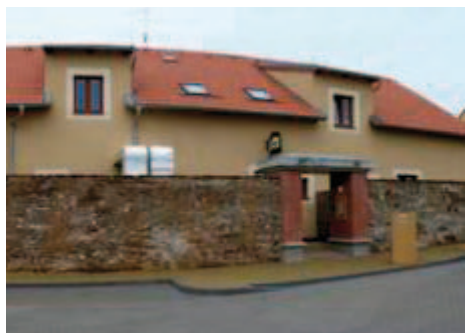
Penzion v Horšově

Díky tomu, že školní statek i vzácnou oboru vlastní Plzeňský kraj, který je zároveň zřizovatelem SOŠ a SOU Horšovský Týn, se zde zachovalo nejen zemědělské vzdělávání, ale rozvíjí se zde v České republice ojedinělá vize zapojení i dalších oborů školy do učebních „podnikatelských aktivit“.