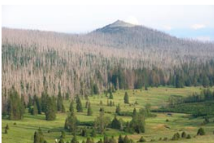
Kůrovce raketovým tempem devastuje šumavské smrkové porosty

Petr Smutný. Mnohem vstřícnější podmínky by měly mít pro své záměry i šumavské obce. „Návrh zákona zahrnuje zřízení čtvrté zóny, která bude určena pro jejich rozumný rozvoj,“ dodává krajský radní.