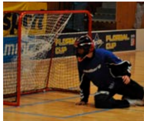
Mistrovství světa škol ve florbalu – Plzeň 2011

Celý florbalový týden byl jednak přehlídkou krásných sportovních výkonů, ocenění by si však zasloužili také pořadatelé, kteří akci zvládli na výbornou. Pořadatelských povinností se skvěle zhostil Dům dětí a mládeže ve Stodu s velkou pomocí studentů z Obchodní akademie Plzeň a z Masarykova gymnázia Plzeň.