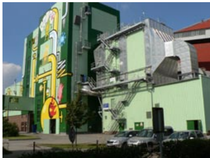
Vyhlášení výsledků soutěže Stavba roku Plzeňského kraje za rok 2010 (str. 8)

Plzeňský kraj Pro Plzeňský kraj vydává NAVA Nakladatelství a vydavatelská agentura nám. Republiky 17, 301 00 Plzeň Náklad: 255 000 výtisků ZDARMA E-mail: redakce@plzensky-kraj.cz Telefon: 377 195 231 Registrováno pod číslem: MK ČR E 14873 Distribuce výtisků zdarma Neoznačené články jsou redakčními materiály