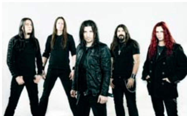
Česká skupina Firewind

O prvním víkendu letních prázdnin (1. - 3. 7.) se letos již podeváté uskuteční hudební festival Basinfirefest. Akce, která se koná pod záštitou Plzeňského kraje, opět proběhne ve festivalovém areálu u malebného městečka Spálené Poříčí a již uzavřený program nabídne zahraniční headlinery i budoucí hvězdy a to nejlepší, co může nabídnout domácí rocková, metalová, ska i punková scéna.