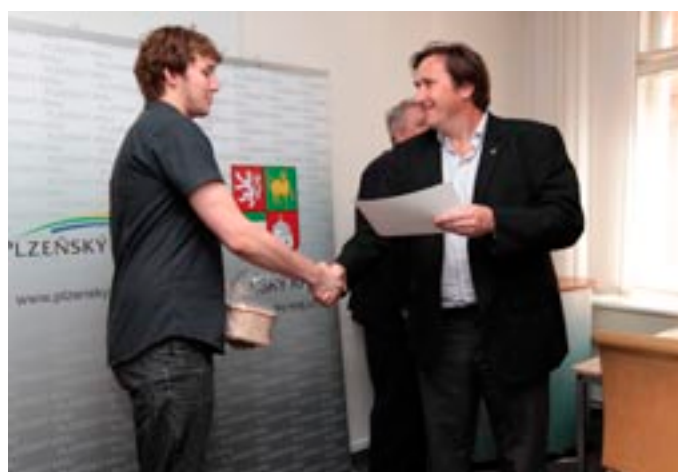
Ocenění vítězů soutěže „Jsi kreativní? Tvůj kraj Tě potřebuje!“ (str. 10)