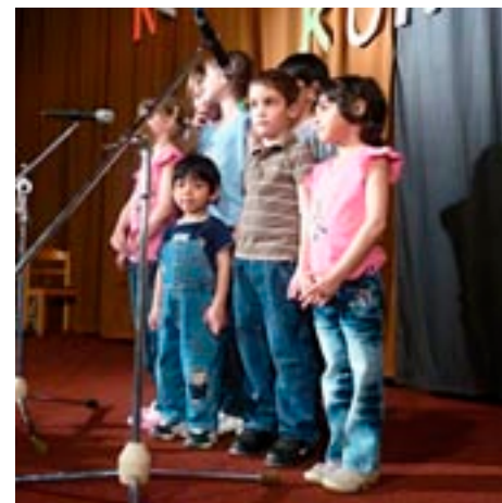
Plzeňský kraj chce pomoci dětem z dětských domovů v jejich kroku do života

rů se budou vzdělávat v oblastech mezilidské komunikace, smysluplného trávení volného času, finanční gramotnosti či řešení ztráty zaměstnání.