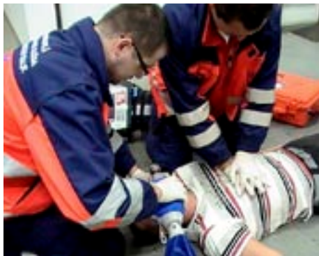
Ukázka první pomoci

Otokem hlasových vazů se ztíží průchodnost vzduchu, dítě někdy chraptí, ale častěji se objeví suchý, drsný, štěkavý či kokrhavý kašel a často bez dalších varovných příznaků se přidá namáhavé dýchání. Onemocnění může probíhat i bez zvýšené teploty. Každé nadechnutí je provázeno drsným zvukem, dítě dýchá s obrovskou námahou, stupňující se neklid situaci ještě zhoršuje, dítě je bleďé, pokryto studeným potem, vdech i výdech je stále obtížnější. Většinou k této komplikaci dochází v noci a rodiče, kteří jednou takový stav zažili u svého dítěte, nikdy na něj nezapomenou. Je tak nutné vždy co nejdříve přivolat záchranáře zatelefonováním na linku 155. Do doby, než záchranáři přijedou, je nutné dát dítěti dýchat studený vzduch (ten snižuje otok v krku). Můžete tak dítě odnést k chladicímu boxu či mrazáku, který na něj otevřete. Chladný vzduch, který bude dítě dýchat, napomůže k zlepšení jeho stavu.