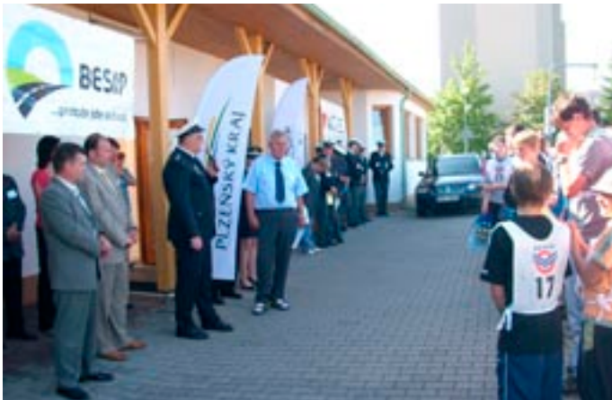
Slavnostní vyhlášení vítězů