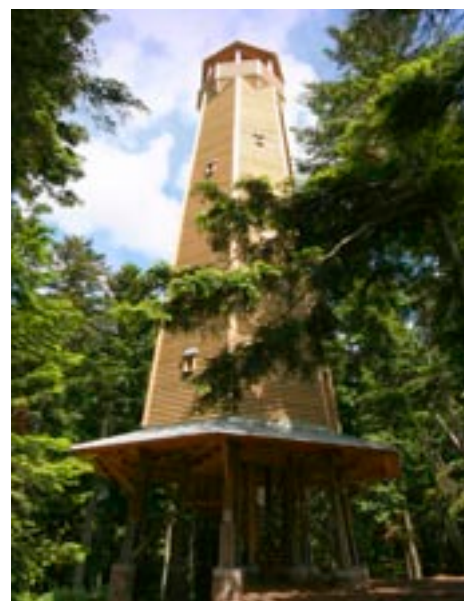
Rozhledna na Sedle u Albrechtic - jeden z cílů Prázdninové štafety

Ti, kteří se rozhodnou Prázdninové štafety zúčastnit, musí své vyplněné účastnické listy do 4. září 2011 zaslat na adresu Zoologické a botanické zahrady města Plzně. Výherce bude pak vylosován v rámci Mezinárodního veletrhu cestovního ruchu Plzeňského