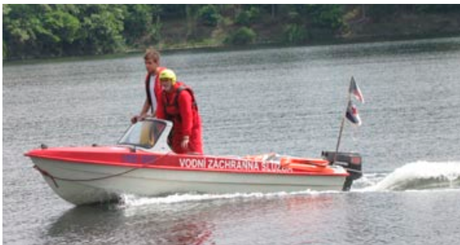
Vodní záchranáři na Hracholuskách při ukázce záchranné akce

V rámci slavnostního otevření stanice Vodní záchranné služby proběhl také Dětský den, kterého se vodní záchranáři zúčastnili a dětem předvedli jak ukázky záchranné akce na vodě, tak některé techniky první pomoci na souši. Na Dětském dnu pod záštitou Plzeňského kraje nechyběly ani atrakce či projížďka na koni.