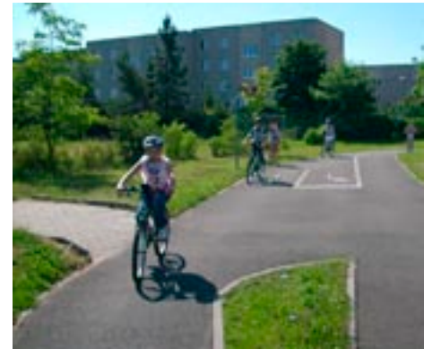
Jízda na dětském dopravním hřišti dle PSP