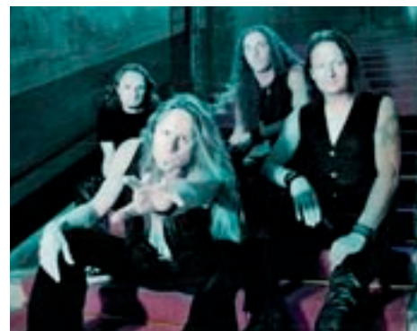
Němečtí Freedom Call

Vstupenky je možné objednávat přímo na oficiálních festivalových stránkách www.basinfirefest.cz nebo exkluzivně v předprodejní síti Ticketstream. Na webu jsou k dispozici také informace o cenách vstupenek pro děti - ty nejmenší mají vstup zdarma.