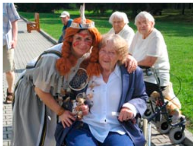
Představení domovů pro seniory SEMMIKRÁSKA a KOPRETINA (str. 14)