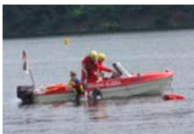
Vodní záchranáři na přehradě Hracholusky

nejvíce přiblíží ke správné odpovědi. V případě shody ve správných odpovědích u více soutěžících vyhrává ten, který svou odpověď doručil jako 10. v pořadí ze správných. Svě odpovědi zasílejte elektronicky na adresu redakce@plzensky-kraj.cz, a to do 30. června 2011. Výherce získá víkendový pobyt právě v kempu Keramika na přehradě Hracholusky. Podrobná pravidla soutěže naleznete na internetových stránkách Plzeňského kraje – www.plzensky-kraj.cz a www.kempkeramika.cz