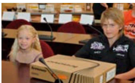
Jeden z vítězů soutěže s cenou za svůj výrobek