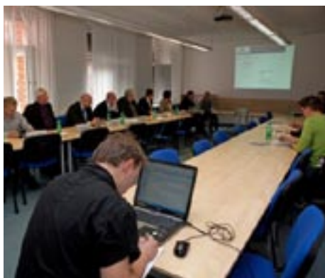
Nákup energií pro Plzeňský kraj na kladenské burze 5. 2011 – úspora 14 milionů korun

prostředí, zrychlení komunikace mezi zadavateli a dodavateli, lepší přístup malých a středních podniků k veřejným zakázkám, vyšší transpa-